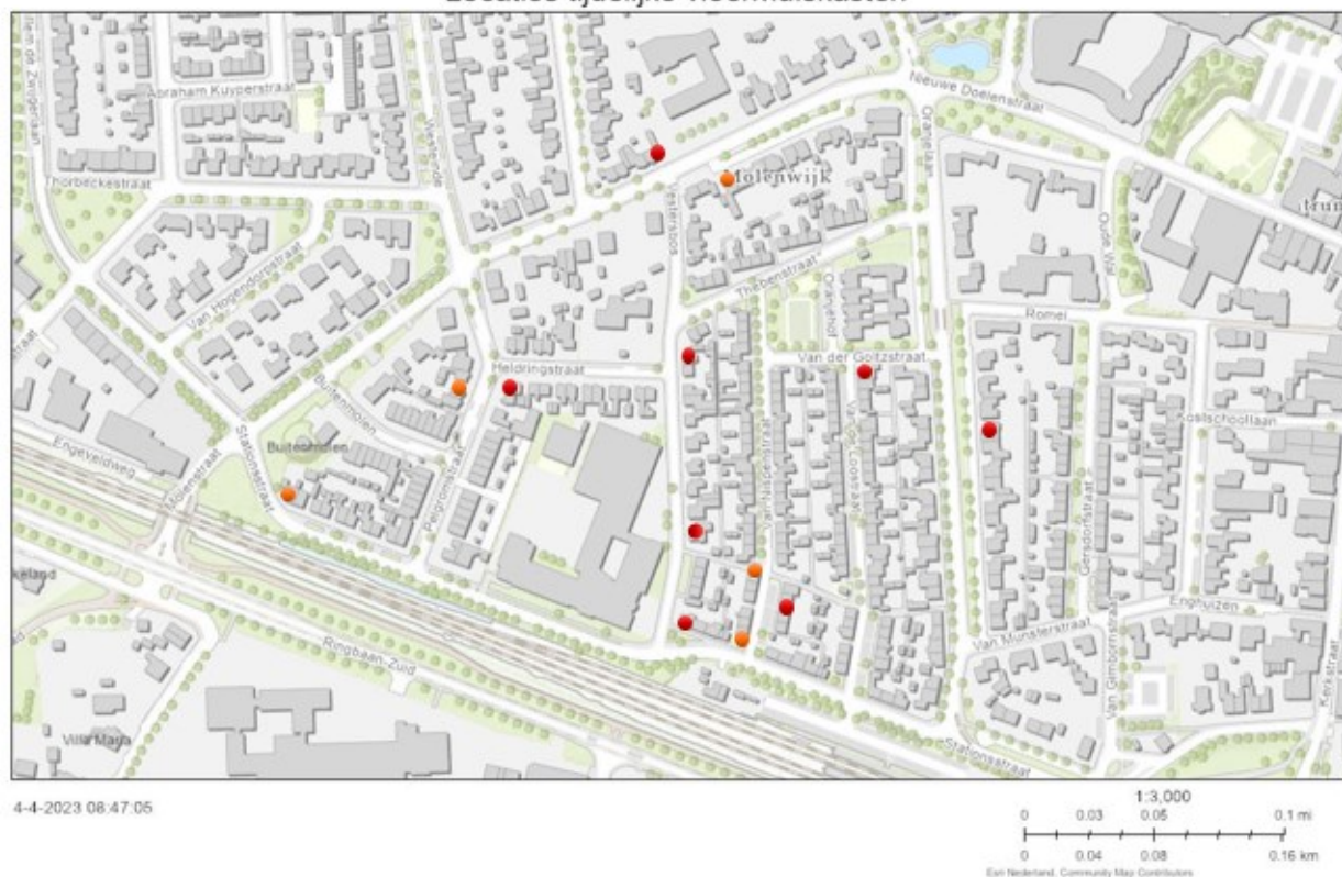
Figuur 1. Locaties tijdelijke vleermuiskasten. Rood = 1 kast, oranje = 2 kasten.