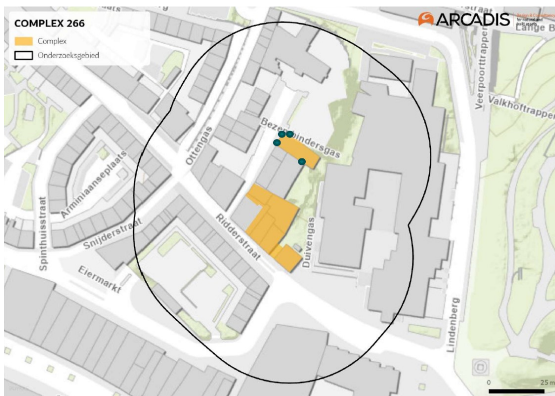
Figuur 3: Locaties permanente vleermuisvoorzieningen (groene stippen) op kaart.