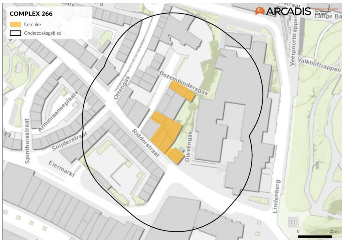
Figuur 1: Ligging plangebied. De bebouwing waar onderhoudswerkzaamheden zullen plaatsvinden zijn op de kaart weergegeven in oranje/geel. De zwarte omlijning geeft de grenzen van het onderzoeksgebied aan.