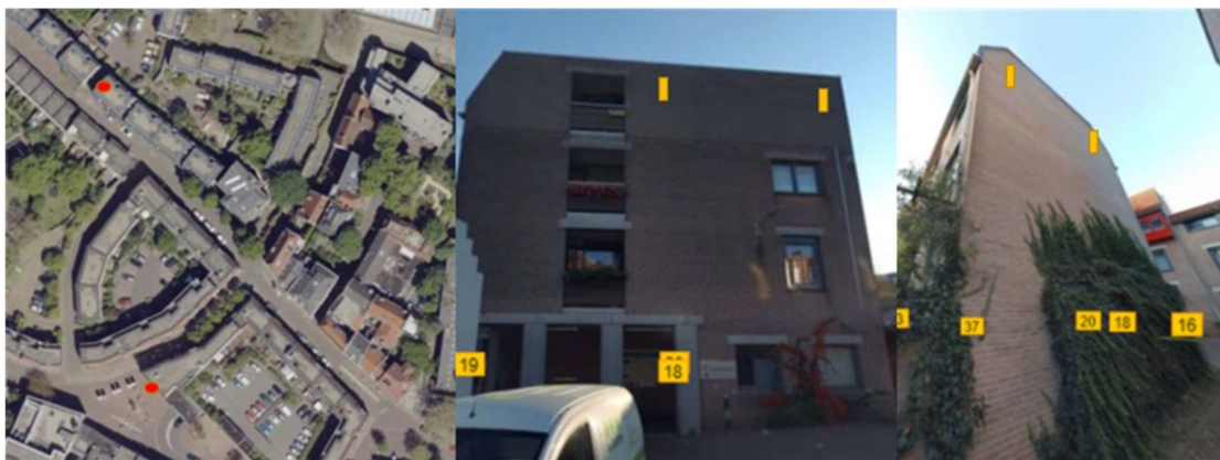
Figuur 2: Locaties tijdelijke vleermuisvoorzieningen (Muchterstraat 23 t/m 27, Snijderstraat 4 t/m 48 te Nijmegen). Links: ligging locaties (rode stippen) op kaart. Midden: locaties van vleermuisvoorzieningen (gele rechthoeken) op gevel Snijderstraat. Rechts: locaties van vleermuisvoorzieningen (gele rechthoeken) op gevel Muchterstraat.