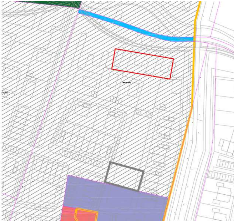
Figuur 4. De aanplant van fruitbomen (rood omkaderd) t.o.v. het plangebied (grijs omkaderd).