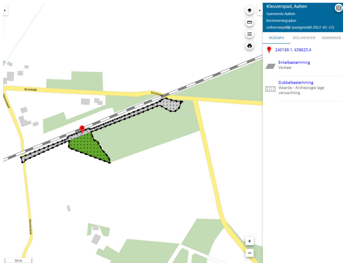
Figuur 3: Onherroepelijk bestemmingplan “Kleuverspad Aalten”. De bestemming op de kaplocatie is “Verkeer”.