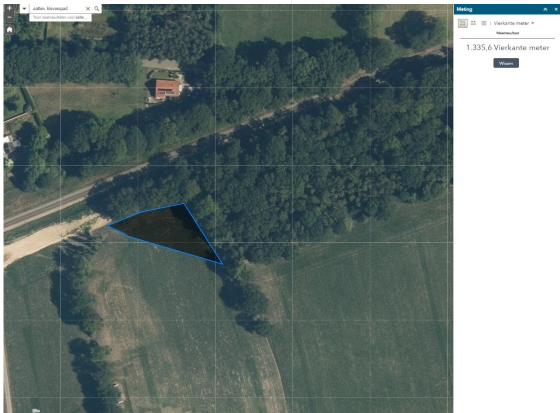
Figuur 2: Ligging herplantlocatie kadastraal perceel Aalten, sectie ■■■ nummer ■■■. Het oppervlak is 1336 m 2 .