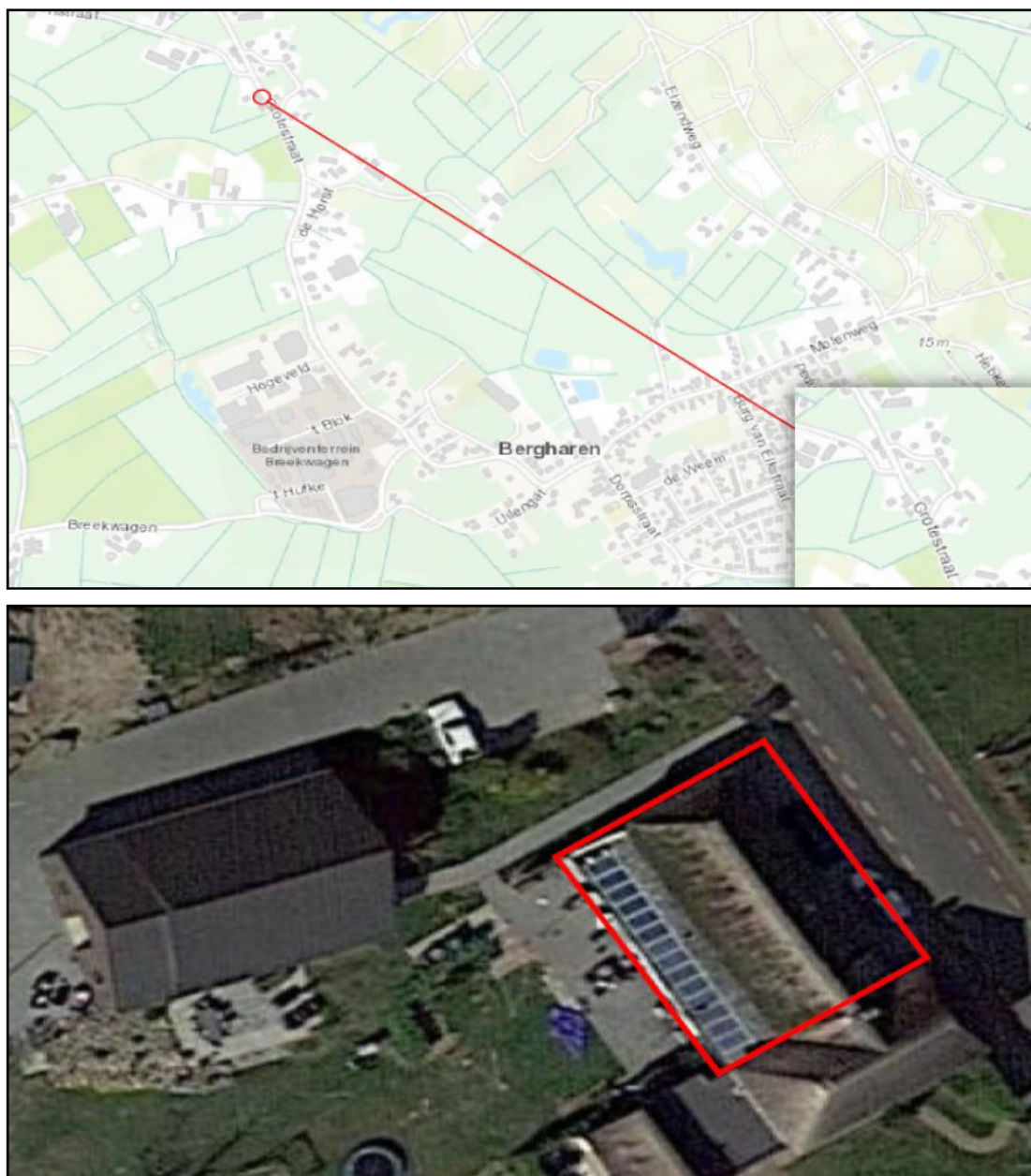
Figuur 1. De ligging en begrenzing van het plangebied aan de Grotestraat 21 te Bergharen (rood omcirkeld). Op de onderste afbeelding is een close-up opgenomen (rood omkaderd).