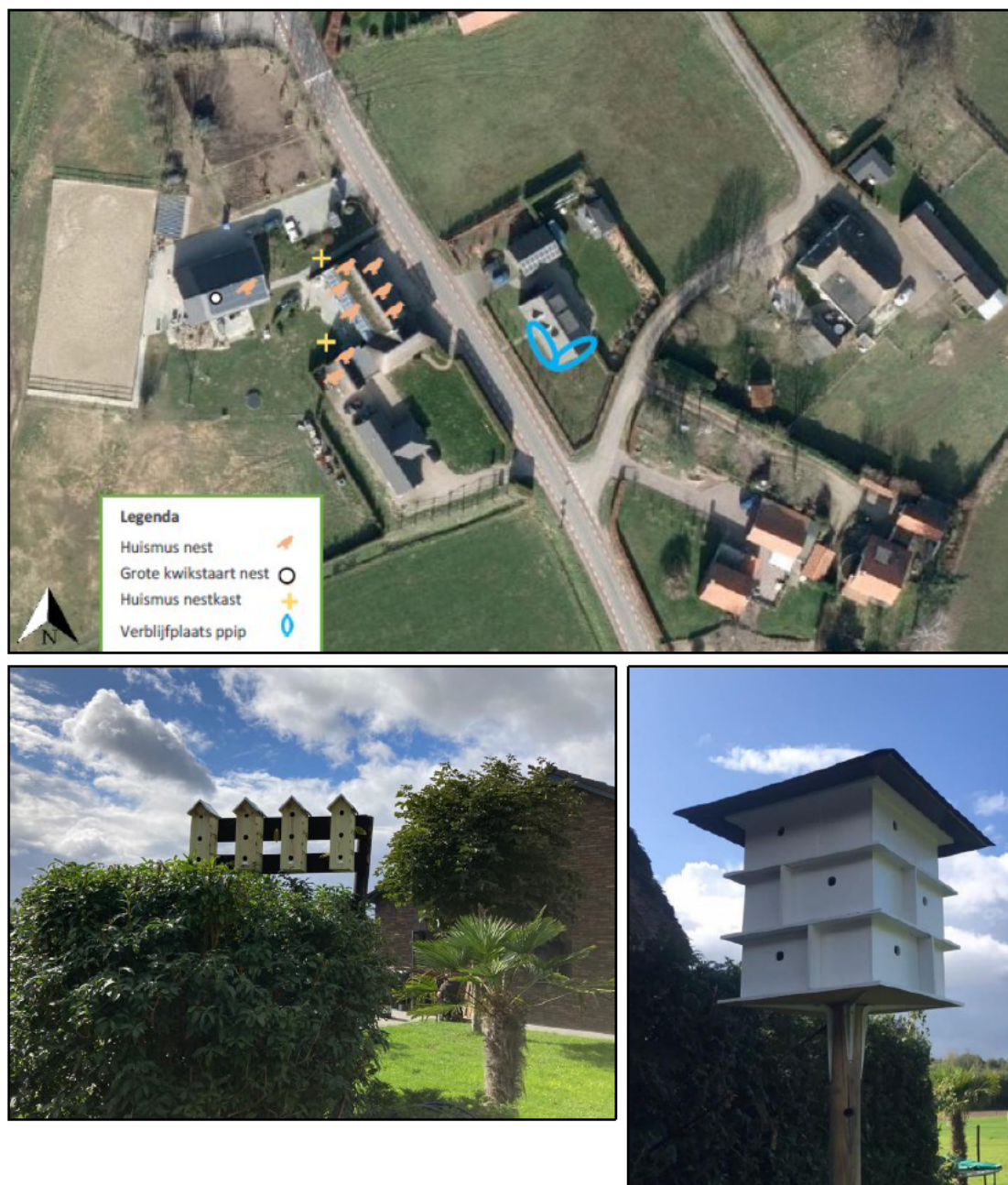
Figuur 2. De locaties van de tijdelijke huismuskasten in de vorm van 4 driedelige kasten op palen en één twaalfdelige huismuspaalkast (gele kruisjes).