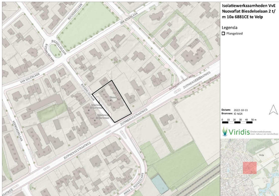
Figuur 1. Ligging en begrenzing projectgebied Nuovaflat aan de Biesdelselaan 2 t/m 10a te Velp.