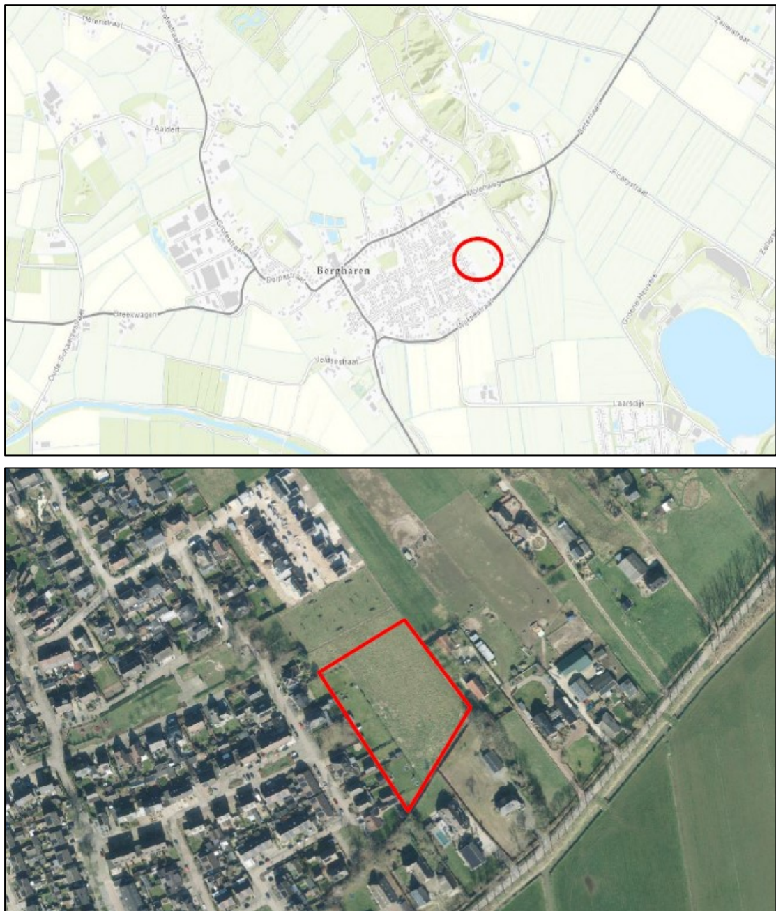
Figuur 1. De ligging en begrenzing van het plangebied ter grootte van circa 0,78 hectare aan de Dorstvlegel te Bergharen (rood omlijnd).