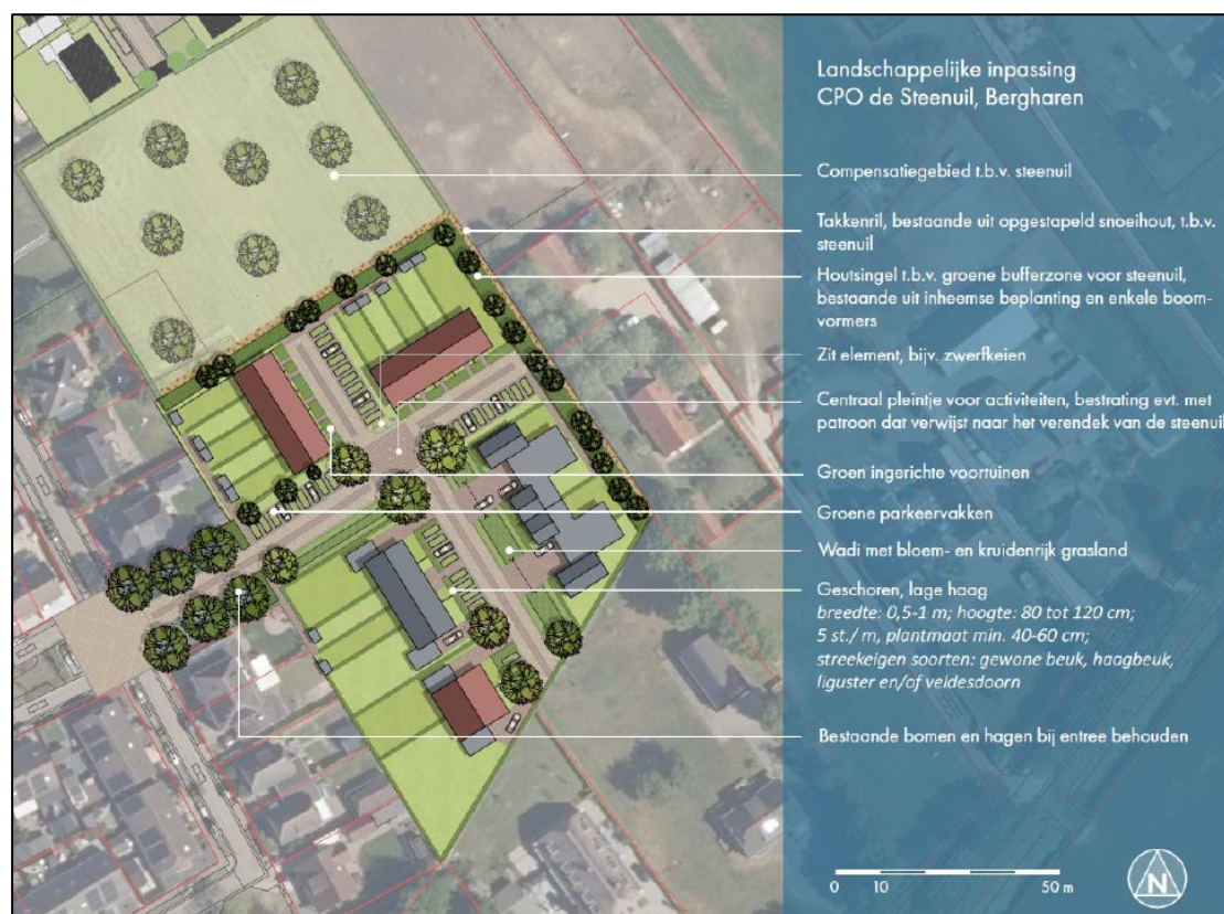
Figuur 5. Een schematisch overzicht van de beoogde nieuwe situatie met 20 nieuwe woningen met bijbehorende groeninrichting bestaande uit het steenuilcompensatiegebied ten noorden, takkenrillen, houtsingels, zitelementen (bijv. zwerfkeien en rasterpalen), een wadi, groen ingerichte voortuinen en parkeervlakken en bomen (uit: 'Activiteitenplan ontheffing Wnb soortbescherming | Woningbouwproject De Steenuil in Bergharen' (Staring Advies, d.d. 9 september 2022)).