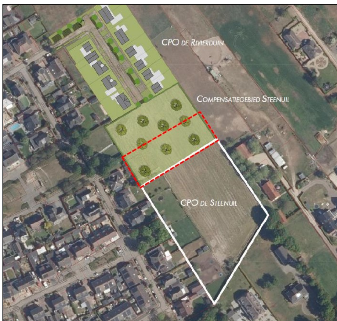
Figuur 2. De locatie van het plangebied ('CPO De Steenuil'), de reeds gerealiseerde woonwijk met 12 woningen ('CPO De Rivierduin') met het bestaande compensatiegebied voor steenuil én de uitbreiding van het compensatiegebied met 2.100 m 2 voor CPO De Steenuil (rood gestippeld omlijnd).