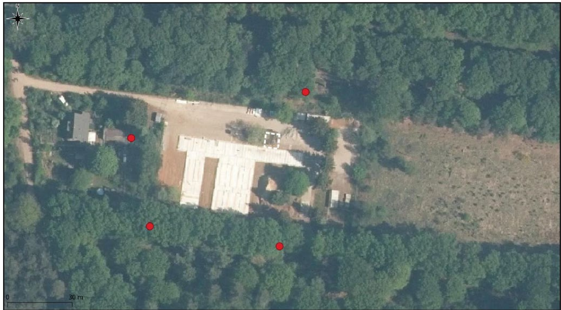
Figuur 2. Locaties van de vier tijdelijke vleermuiskasten rondom het plangebied aan de Verlengde Arnhemseweg 144 te Ede.