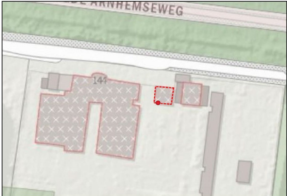
Figuur 1. Het nog te slopen gebouw (rode stippellijn) met een zomerverblijfplaats van gewone dwergvleermuis (rode stip) waarvoor deze ontheffing wordt afgegeven. De overige bebouwing binnen het plangebied is reeds gesloopt en maakt dus geen deel uit van deze ontheffing.