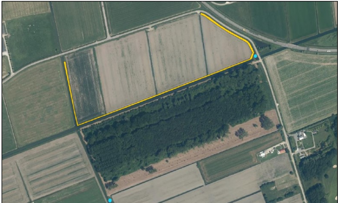
Figuur 2. De locatie van de aan te leggen natuurvriendelijke oever aan één zijde van de watergang over een lengte van ca. 1 km (oranje lijn) en de twee te realiseren marterhopen (blauwe stippen). De marterhopen worden minimaal 3 maanden voorafgaand aan de werkzaamheden gerealiseerd.