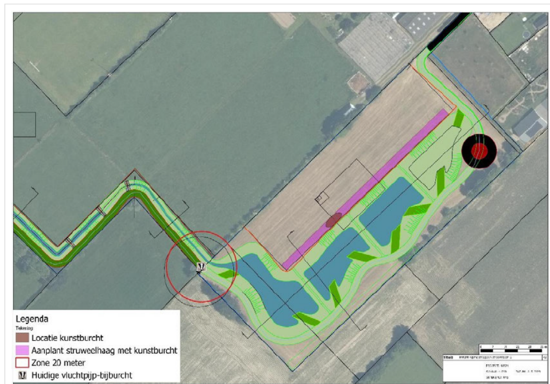
Figuur 3: Nieuwe (kunst)burchtlocatie van de das binnen het plangebied Stroombaan 2 (bruine stip in paarse lijn (=aanplant struweelhaag)).