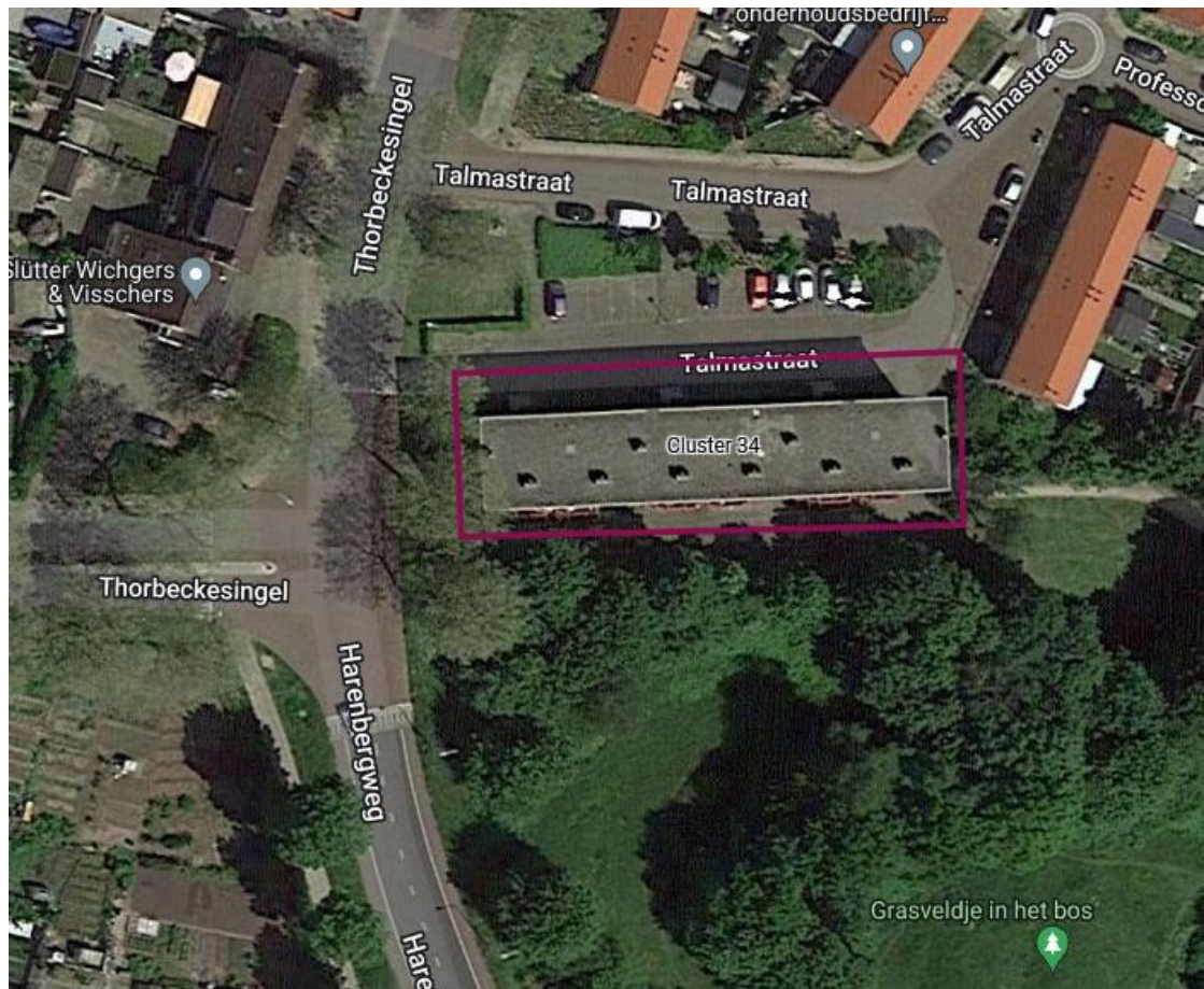
Figuur 1 Het te renoveren complex 261 aan de Talmastraat 31-65 te Zutphen en tevens cluster van onderzoek is met een maroon rode lijn aangegeven.