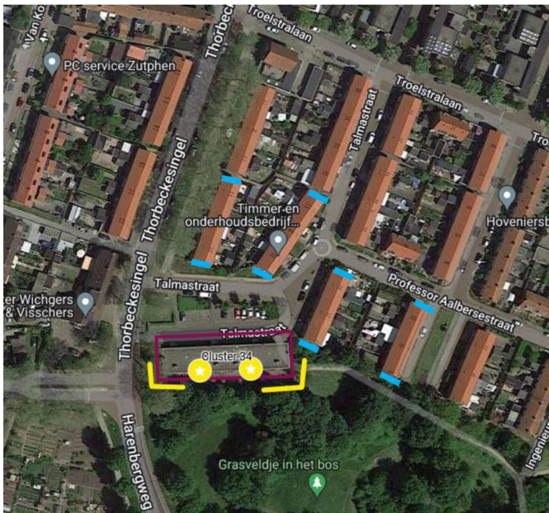
Figuur 2 De tijdelijke vleermuiskasten (blauwe lijnen) ten opzichte van het plangebied (het maroon rode kader met complex 261 aan de Talmastraat 31-65 te Zutphen), waarin twee zomerverblijfplaatsen (gele stip met witte ster) en twee paarverblijfplaatsen (gele lijn) zijn waargenomen. Elke blauwe lijn staat voor twee tijdelijke vleermuiskasten.