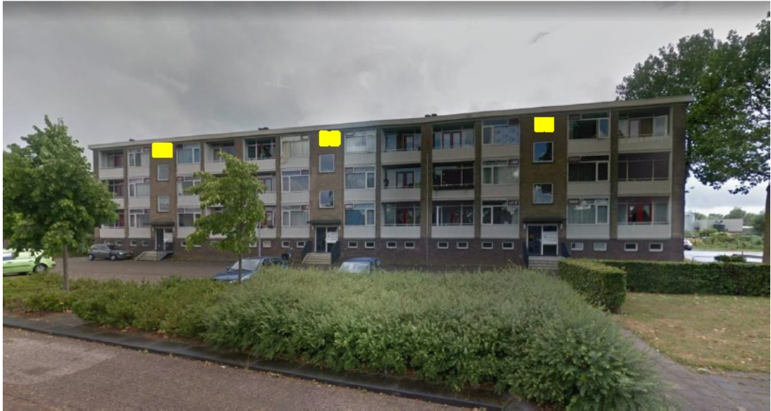
Figuur 3 Complex 261 aan de Talmastraat 31-65 te Zutphen met de positie van de permanente voorzieningen op de voorgevel bestaande uit inmetselfkasten (gele vlakken).