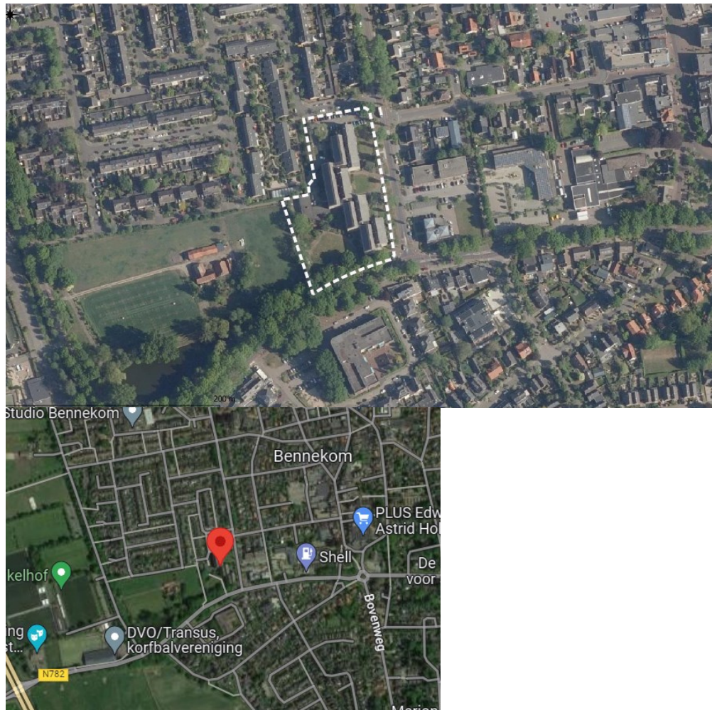
Figuur 1: Plangebied (Econsultancy, 2022)