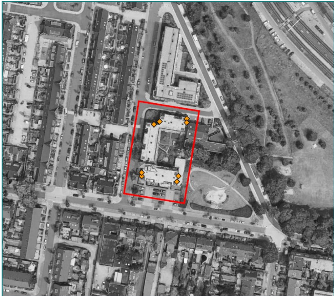
Figuur 2: Overzicht plangebied (binnen het rode kader) met de locaties van de permanente kasten.

◆ Vleermuiskasten - inmetsetype - IB VL 04/08 - 8 stuks