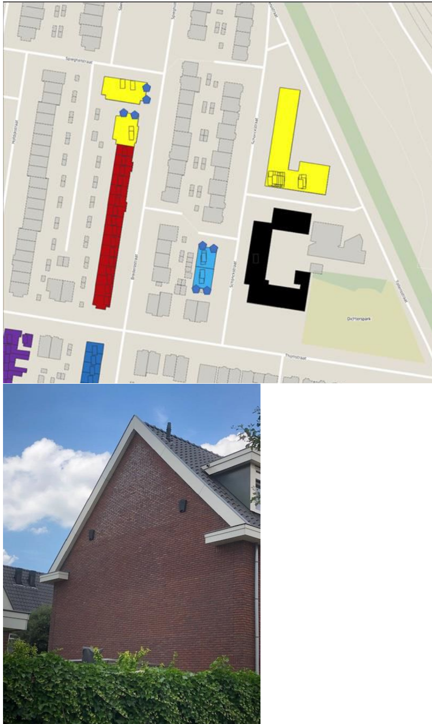
Figuur 2: Locatie tijdelijke vleermuiskasten (Ecochore Natuurtechniek, 2022).