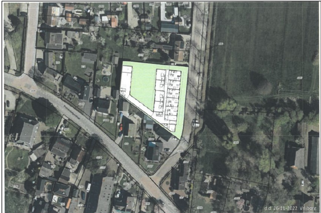
Figuur 2: Schets van de beoogde situatie, betreffende een woonzorgcentrum.