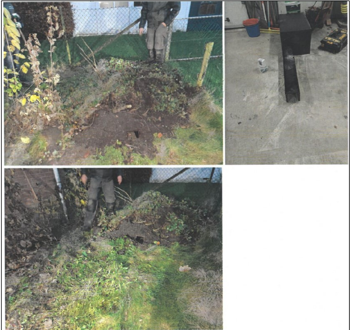
Figuur 4: Foto's van het nieuwe steenmarterverblijf, geplaatst 9 december 2022.