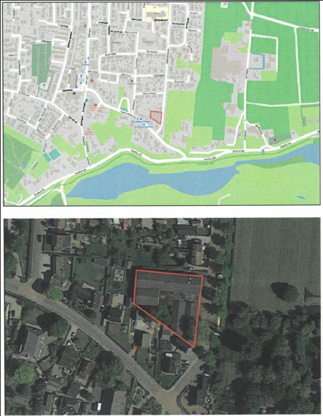
Figuur 1: Algemene ligging van het projectgebied (rood omkaderd).