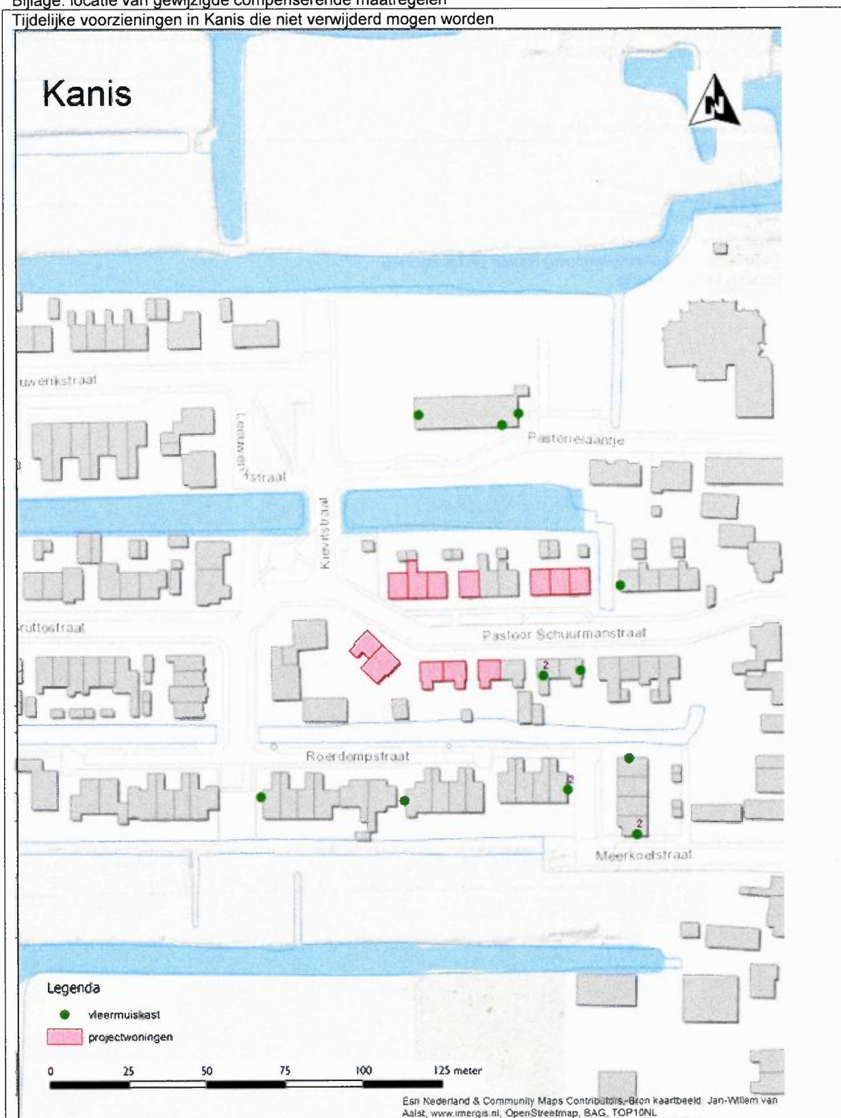
Bijlage: locatie van gewijzigde compenserende maatregelen Tijdelijke voorzieningen in Kanis die niet verwijderd mogen worden