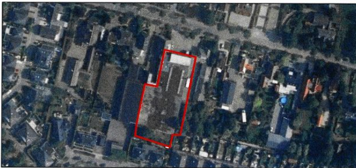
Figuur 2. Begrenzing van het plangebied in rood omkaderd.