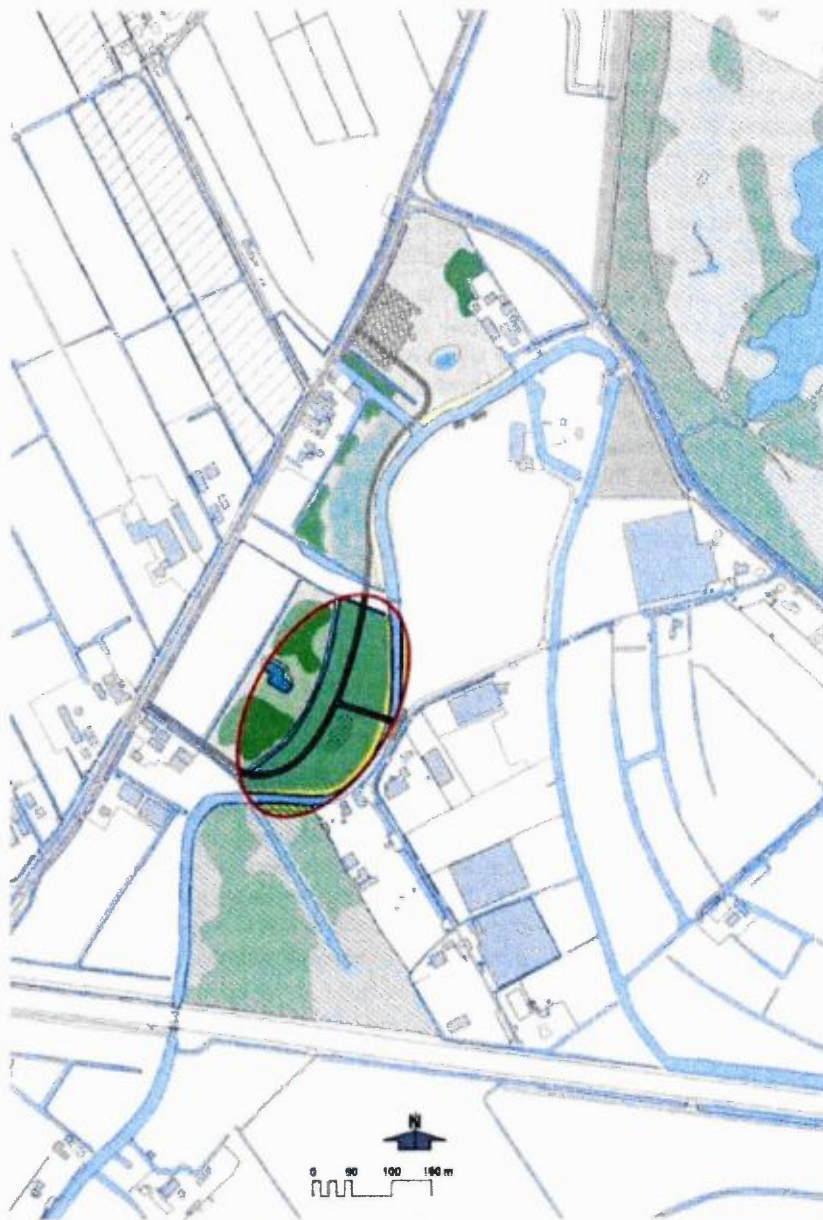
Figuur 1: Breudijk te Harmelen

Kaarten van de compensatielocaties verbonden aan het besluit van Gedeputeerde Staten van Utrecht van 18 juli 2019, domein Leefomgeving, met kenmerk COMP-UT-17-103.