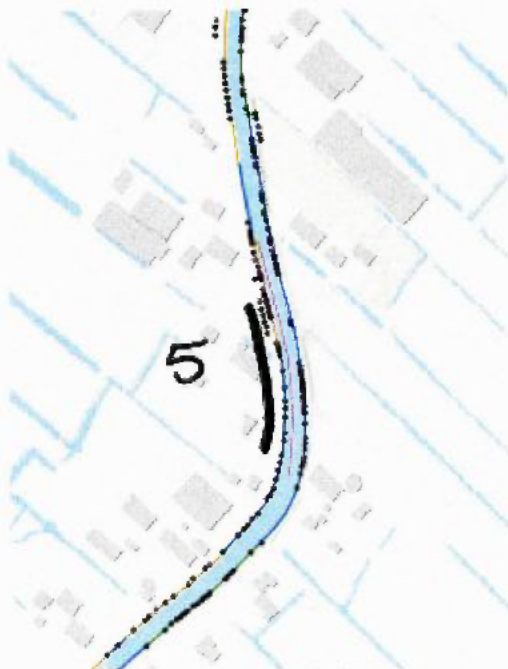
Figuur 4: kaart met paarse lijn die het beschermde element weergeeft. De zwarte strepen geven de locatie van de te kappen bomen aan, waarbij het cijfer het aantal bomen weergeeft.