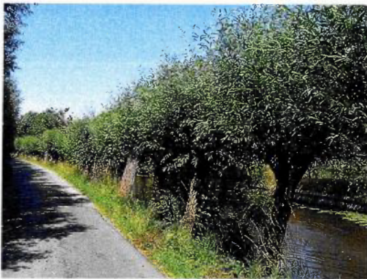
Figuur 1: foto van het betreffende element