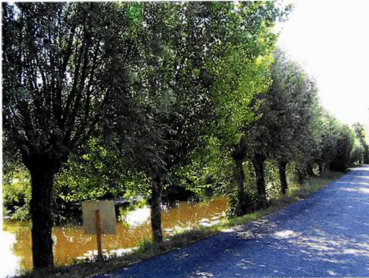
Figuur 3: foto van het betreffende element