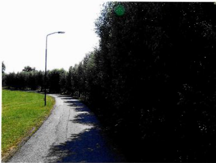
Figuur 5: foto van het betreffende element