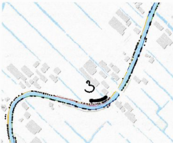
Figuur 6: kaart met paarse lijn die het beschermde element weergeeft. De zwarte strepen geven de locatie van de te kappen bomen aan, waarbij het cijfer het aantal bomen weergeeft.