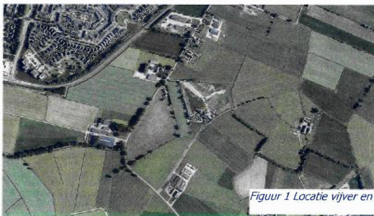
Figuur 1 Locatie vijver en omgeving

De aanvraag betreft een aanvraag om een vergunning op grond van de Ontgrondingenwet voor het realiseren van een recreatievoorziening of vijver (hierna te noemen: vijver). De vijver betreft een uitbreiding van een vijver welke eerder op basis van een vrijstelling van vergunningplicht is gerealiseerd (zie voorgeschiedenis/procedure). De vijver wordt gerealiseerd op het adres Rumelaarseweg 15 te Woudenberg (zie figuur 1). De locatie is gelegen ten zuiden van Woudenberg. De vijver wordt gerealiseerd op het perceel, kadastraal bekend gemeente Woudenberg, sectie H en perceelsnummer 258. De aangevraagde vijver heeft een oppervlak van 2.860 m 2 . Hierbij komt volgens berekening 4.433 m 3 grond vrij welke naast de vijver op het hierboven aangegeven kadastrale perceel wordt verwerkt.