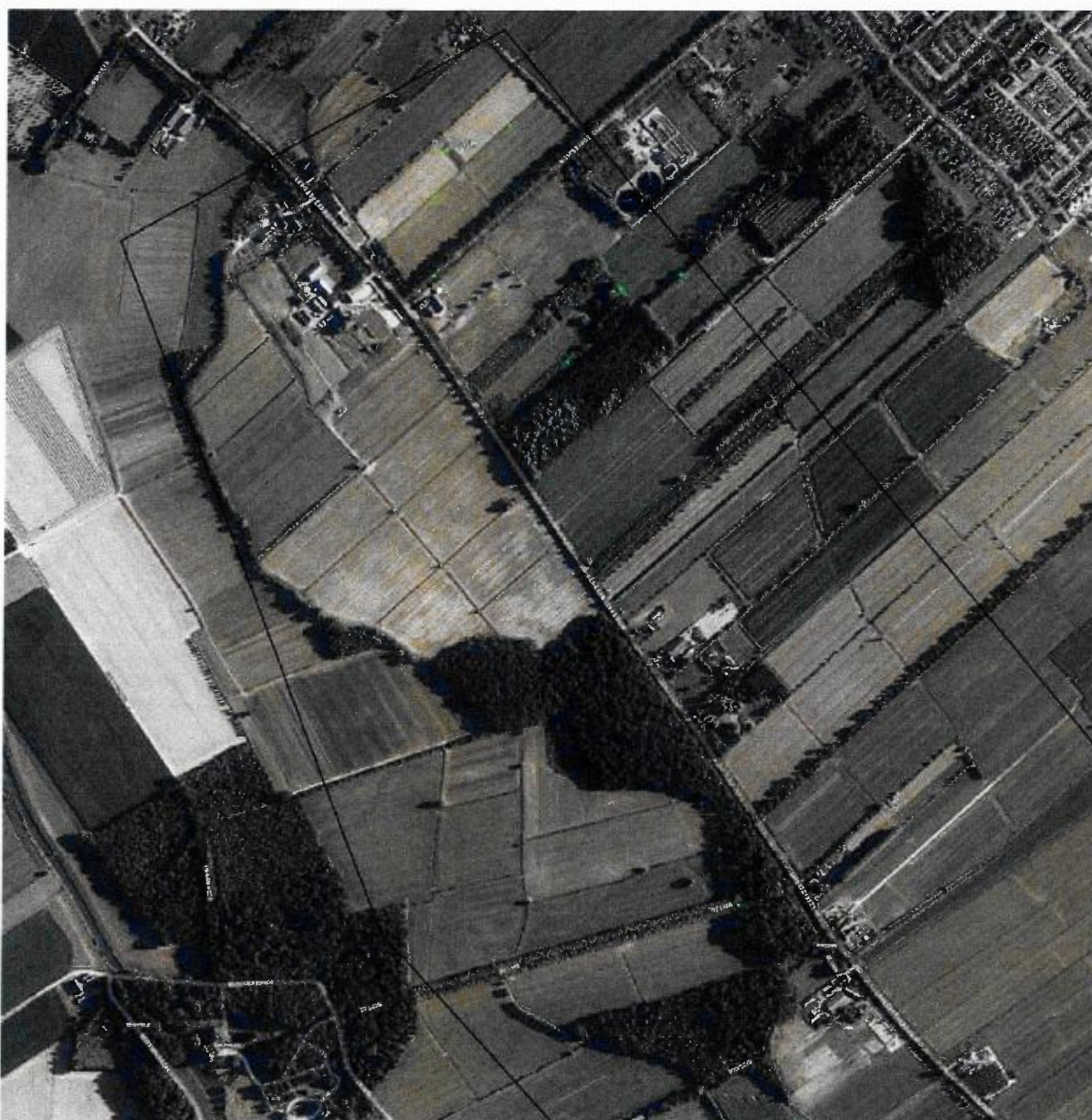
Voorkomen poelkikker in de omgeving van het plangebied