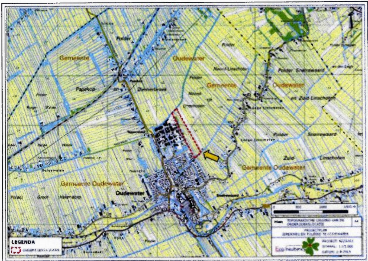
Figuur 1. Topografische ligging van de onderzoekslocatie.