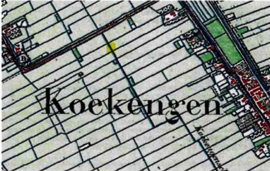
Afbeelding Kaart uit 1880 met in het geel de oostelijk gelegen sloot die onderdeel uitmaakt van de historische lijn met maatvoering van de cope-ontginning.

opleveren van cultuurhistorische waarden. De oostelijk gelegen sloot met een oppervlakte van 150 m 2 maakt echter deel uit van een historische lijn in het landschap die nog zeer goed behouden is, zie ook onderstaande afbeelding. Door deze lijn is de historische maatvoering van de cope-ontginning nog beleefbaar. Het verdwijnen van deze dwarsloot tast deze beleefbaarheid onaanvaardbaar aan.