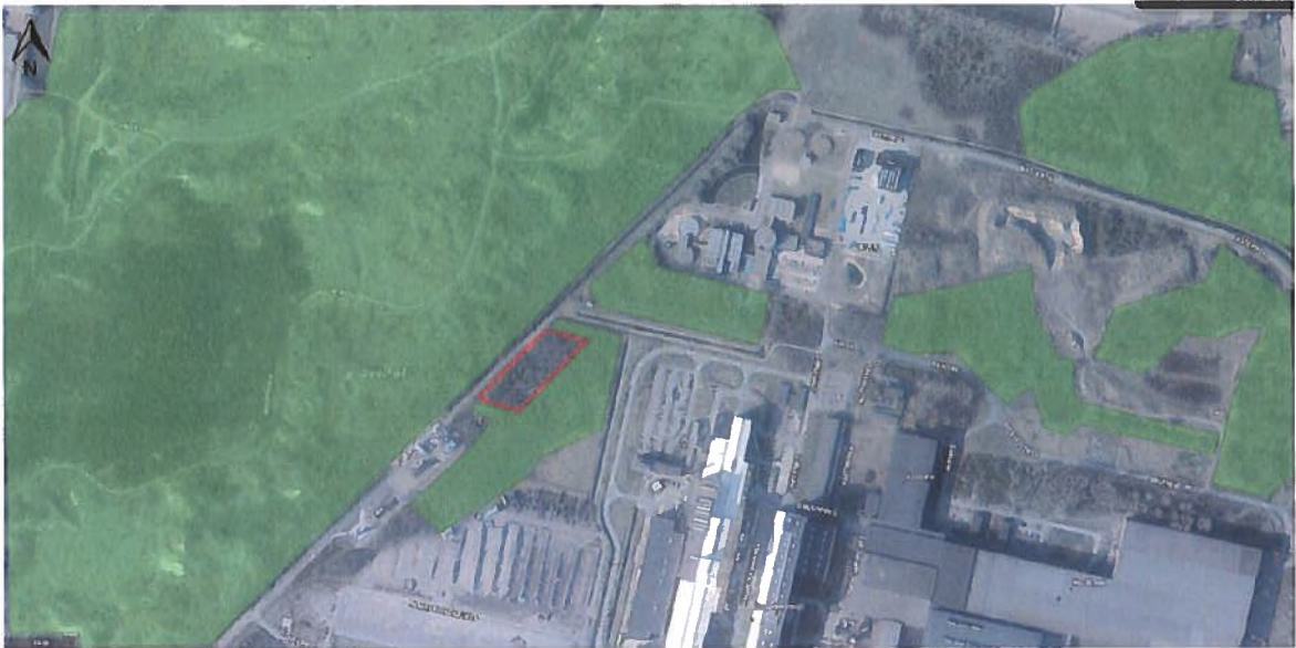
Figuur 1 Planlocatie rood omkaderd, groen (alternatief) leefgebied aangevraagde soorten