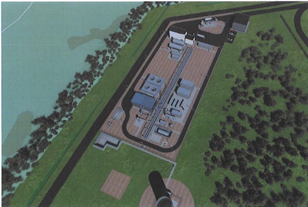
Figuur 2-4: Impressie gasbehandelingsinstallatie, met aan de westzijde de onverharde weg met sloot en de overgang naar de duinen Aan de oostzijde ligt het deel van het struweel dat behouden blijft.