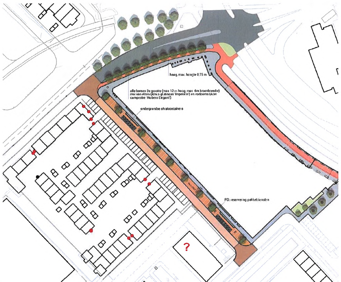
C. Locaties vleermuiskasten (per rode stip = 1 vleermuiskast), het gaat om woningen liggend aan de Satijnhout en Cambarahout te Zaandam. Er is een overtal van twee kasten weergegeven omdat er mogelijk kasten niet gerealiseerd kunnen worden in verband met de bewoners van de complexen.