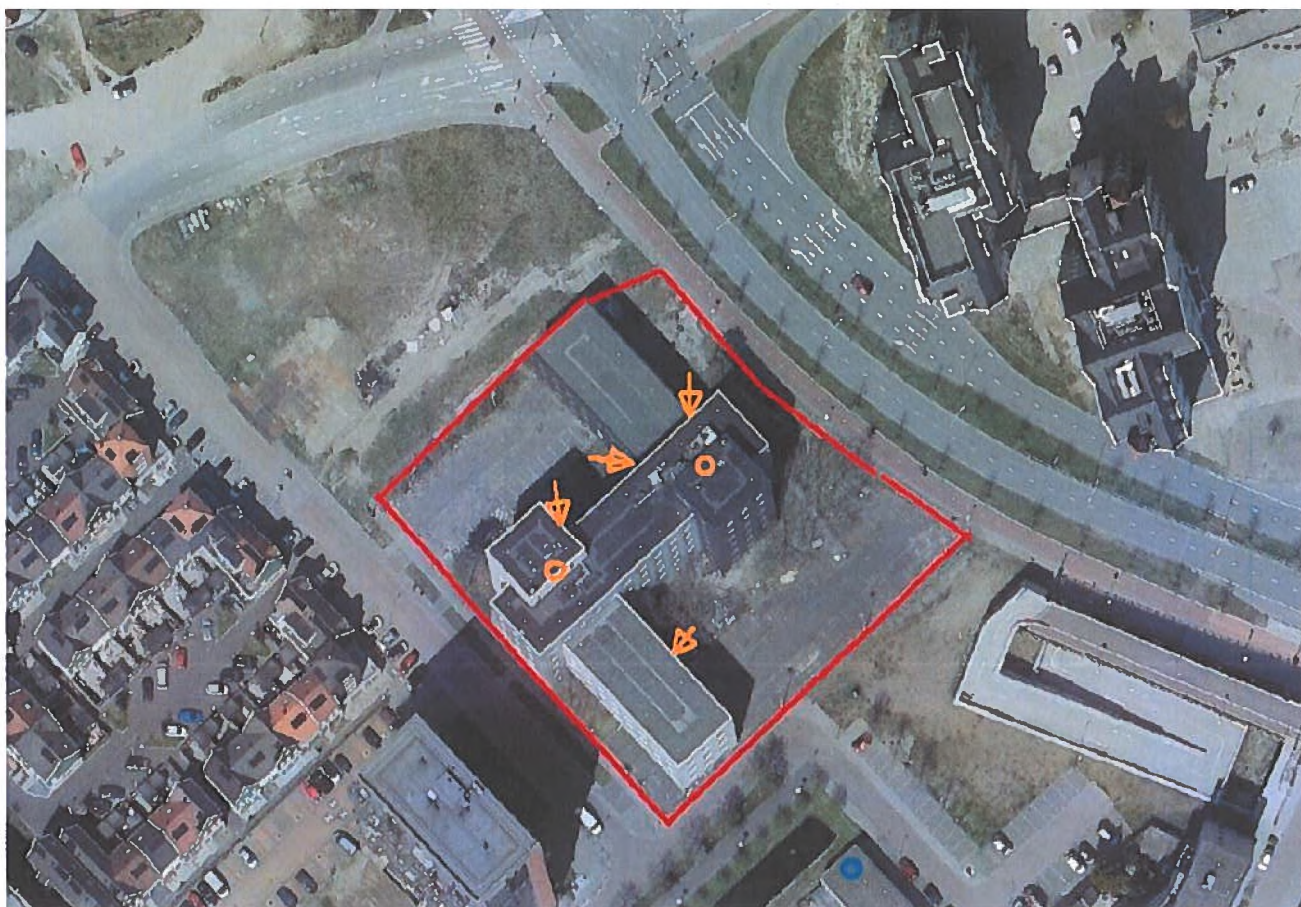
A. Planlocatie (rood omkaderd), met verblijfplaatsen van gewone dwergvleermuizen (pijl = verblijfplaats buitenzijde, cirkel = verblijfplaats in het pand).