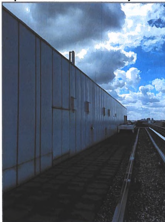
B. Op het gebouw van de omgevingsdienst NZKG zijn acht vleermuiskasten geplaatst, Ebbehout 31, Zaandam.