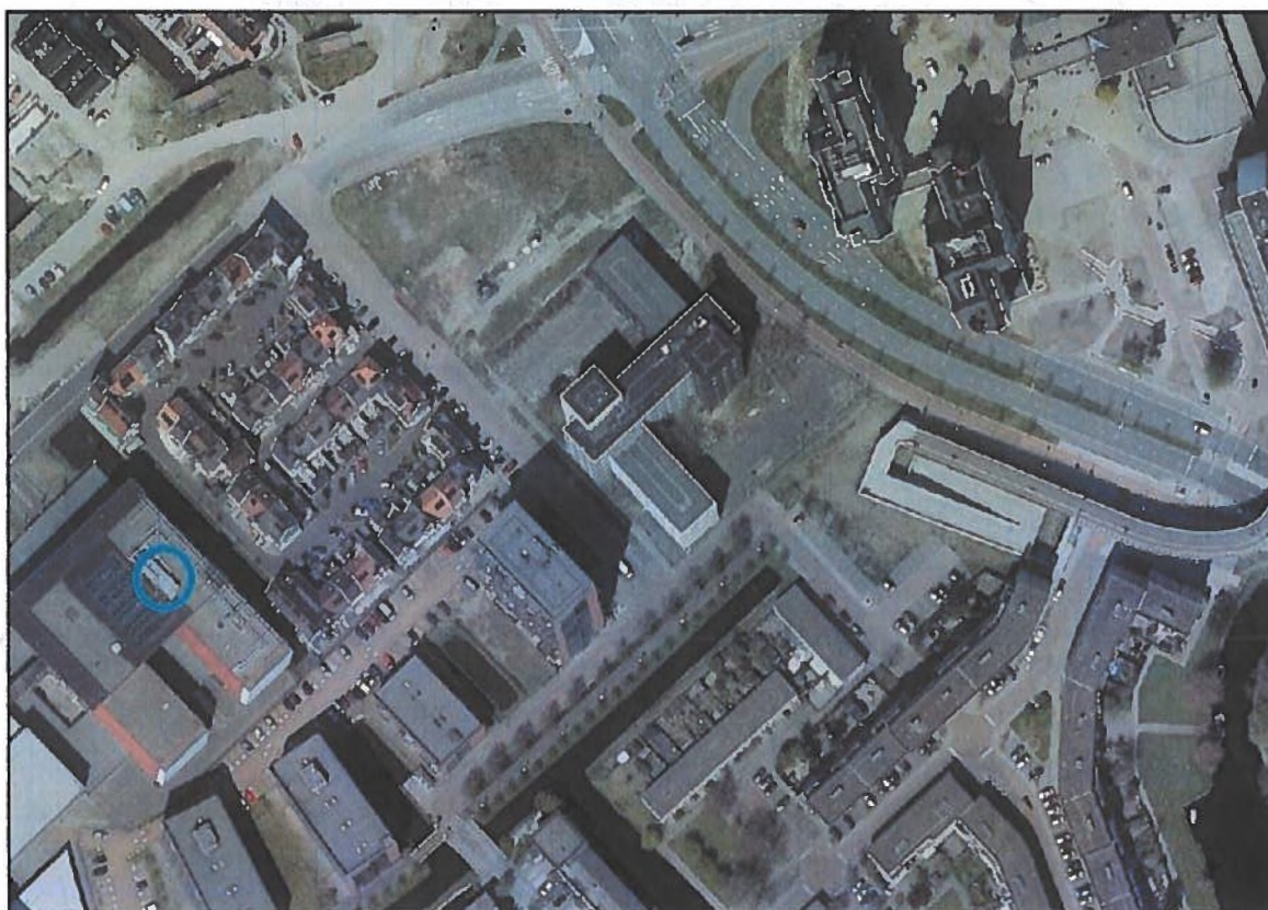
A. Binnen de blauwe cirkel zijn zes vleermuiskasten opgehangen, aan grote ventilatiekanalen op het gebouw van Regio College, Cypresseshout 95-99, Zaandam.