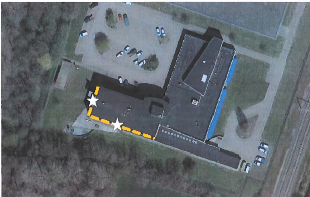
Figuur 10. Zoekgebied permanente compensatie (oranje stippellijn). Ook opgenomen: bestaande verblijven (sterren).