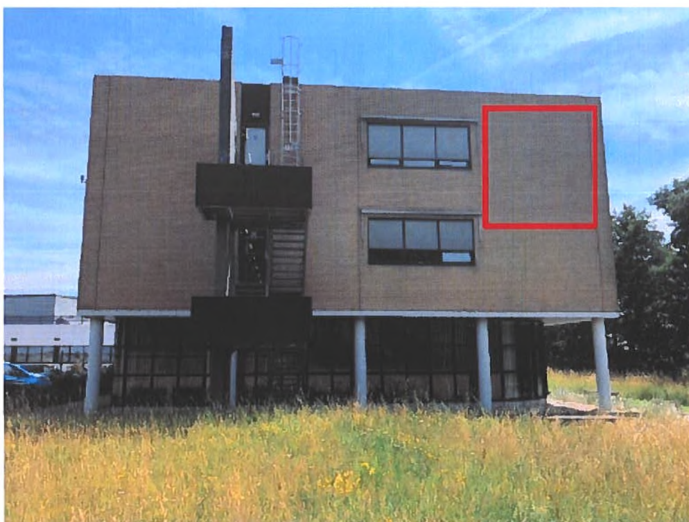
Figuur 11. Zoekgebied 4 inbouwstenen kopgevel (rood).