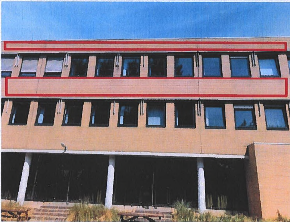
Figuur 12. Zoekgebied 8 inbouwstenen zuldgevel (rood).