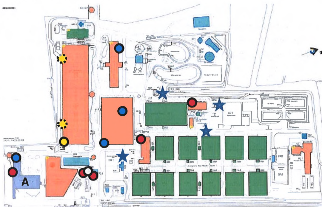
Figuur 3. Vastgestelde vleermuisverblijven (stippen), locatie vestigingsgebouw (A; paars) en bestaande vleermuispalen (sterren)