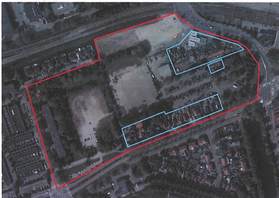
Figuur 1. Locatie van het plangebied (rood) en de te behouden woonerven (blauw).

Straten: Gebied tussen het Pelmolenpad en de Zuiderkruisstraat