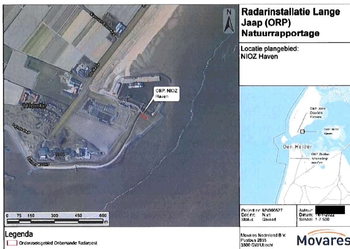
Figuur 1. Plangebied NIOZ Haven, Texel, Noord-Holland.