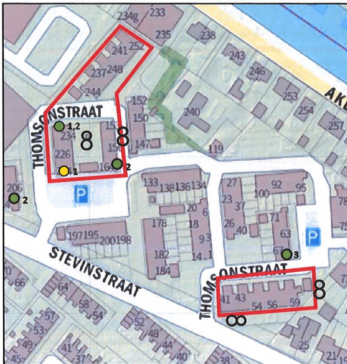
Bijlage 3: Locaties huidige verblijfplaatsen