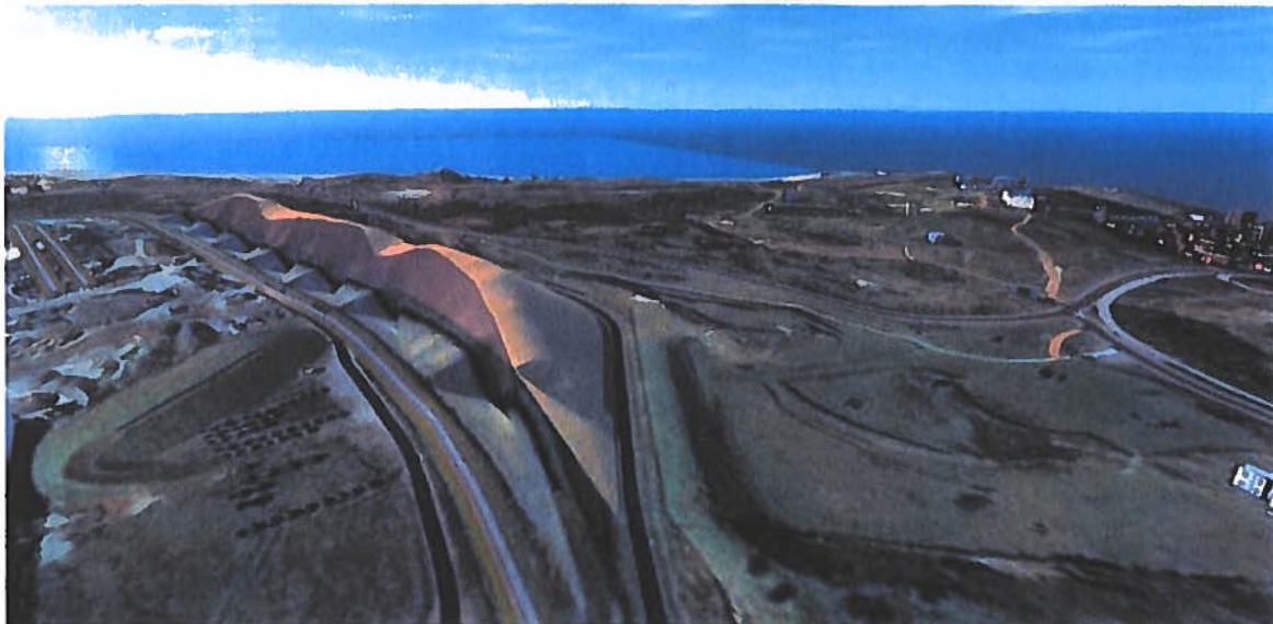
"Artist impression" met zicht op het westen van het beoogde kunstduin (Fig. 3.1 Passende Beoordeling)