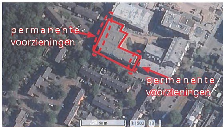
Figuur 3: Locaties permanente alternatieve verblijfplaatsen