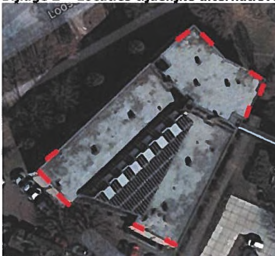
Figuur 2: Locaties tijdelijke alternatieve verblijfplaatsen. Elk rood streepje staat voor twee kasten. Van de twintig kasten zijn minimaal zestien kasten correct opgehangen. Van deze zestien kasten zijn er minimaal acht leeg en daarbij bruikbaar.