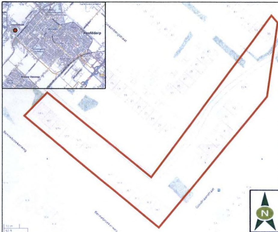
Figuur 1: Locatie plangebied.