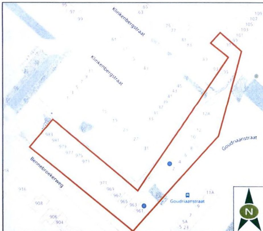
Figuur 2: Locaties huismussennesten aan de Bennebroekerweg 961 en Goudriaanstraat 2.