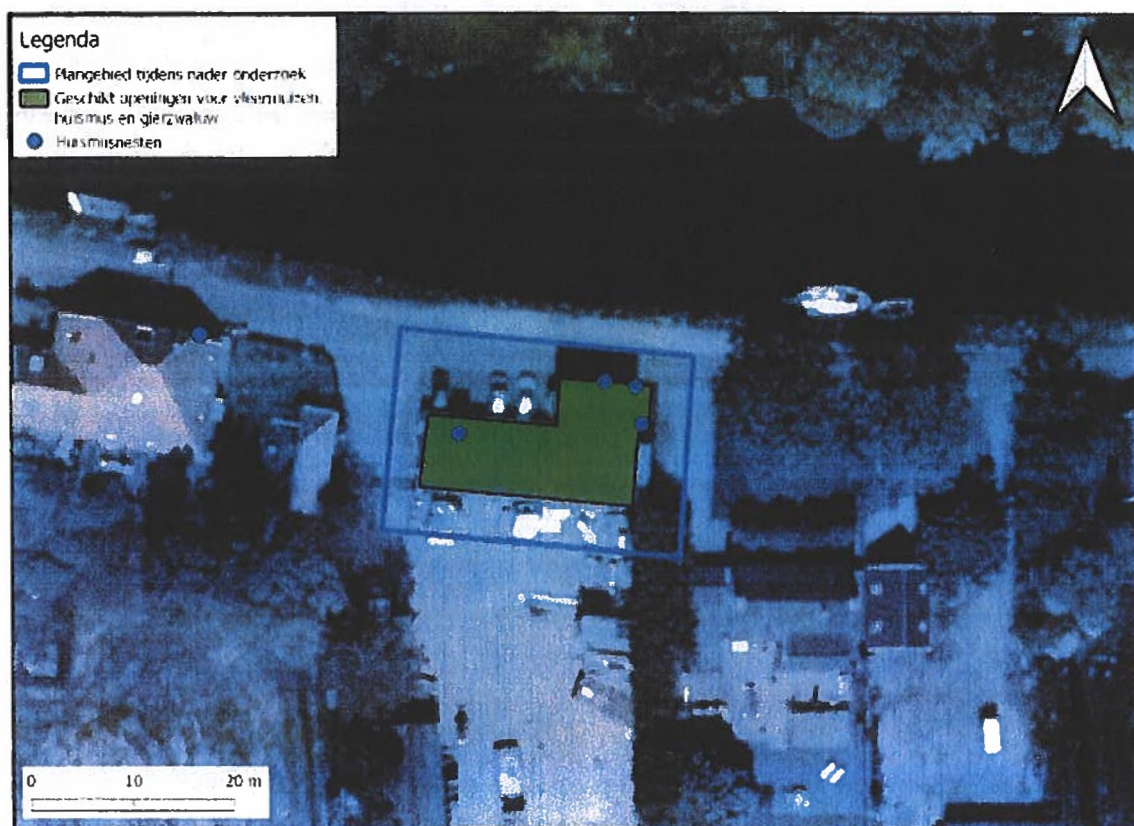
Figuur 6 Resultaten van het huismusonderzoek met de locaties van de aangetroffen huismusnesten binnen en buiten het plangebied