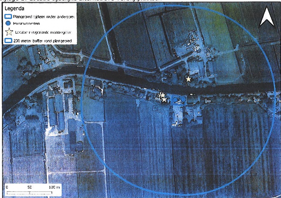
Figuur 7: Locatie mitigerende maatregelen binnen 200 meter buffer ten opzichte van het plangebied