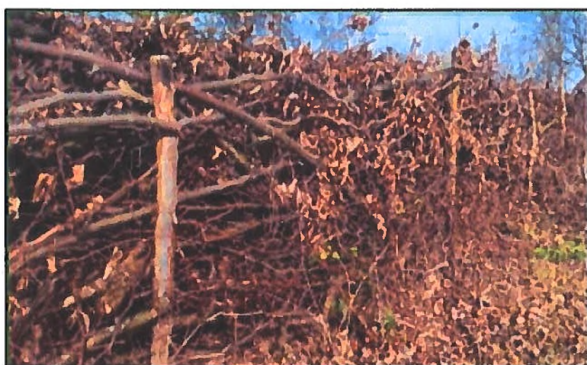
Figuur 6-2. Voorbeeld van een takkenril.