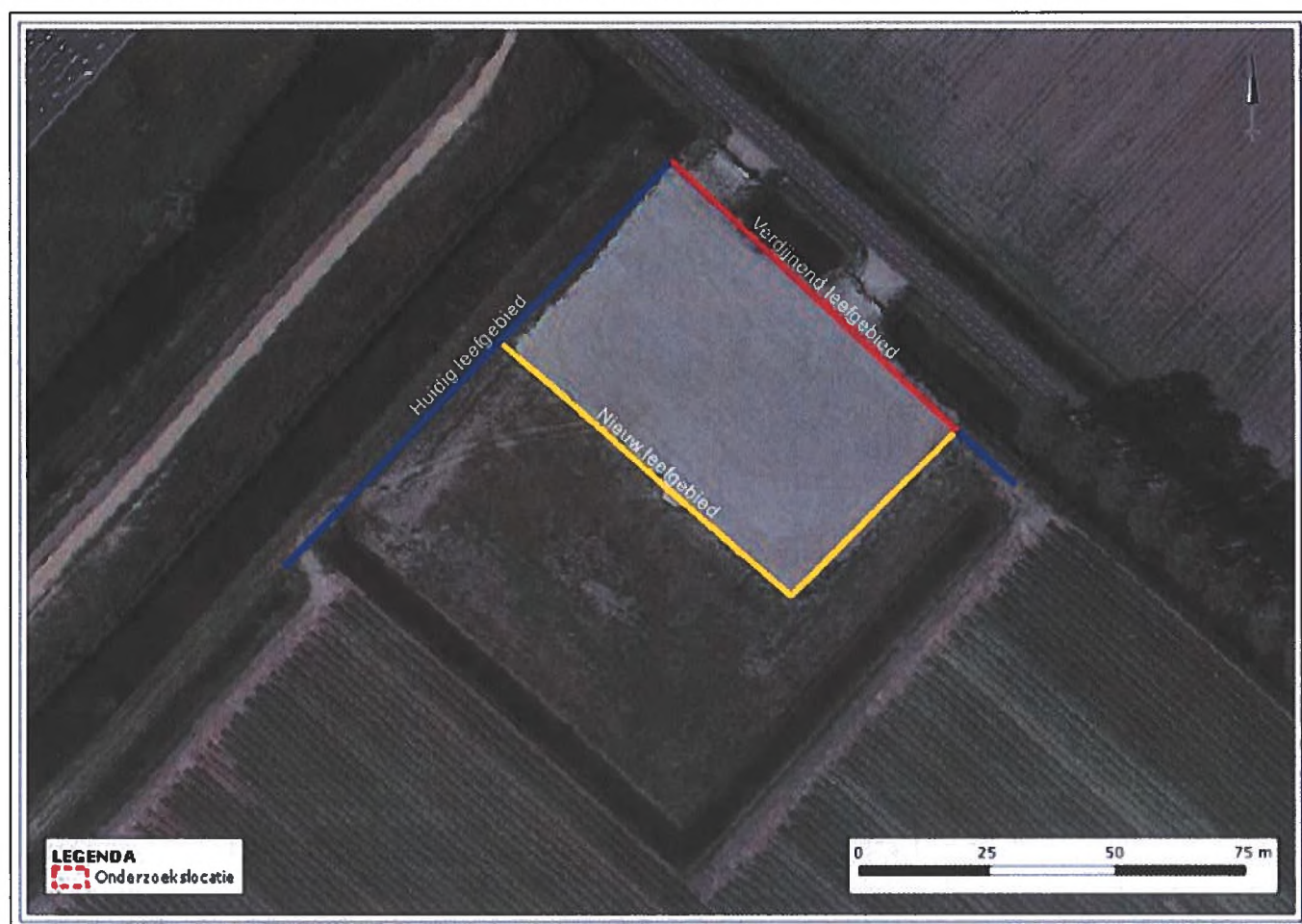
Figuur 6-3. Overzichtskartaal van het huidige leefgebied (aangegeven in het blauw) van kleine marterachtigen in het plangebied, het gedeelte van het leefgebied wat verdwijnt door de voorgenomen ingreep (aangegeven in het rood) en het nieuwe leefgebied (aangegeven in het geel) wat gerealiseerd zal worden voorafgaand aan de nieuwwerkzaamheden (Van der Goes en Groot, 2022).