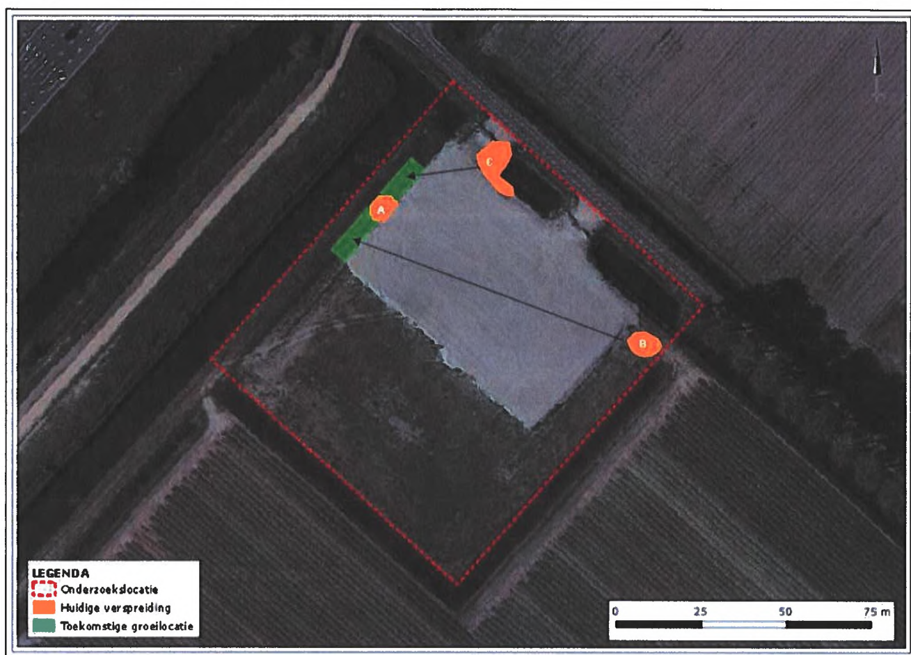
Figuur 6-1. Cluster B en C zullen worden afgeplagd en verplaatst worden naar de toekomstige groeilocatie (aangeduid met zwarte pijlen). De drepszaden zullen gezaaid worden op de toekomstige groeilocatie (aangegeven in het groen).