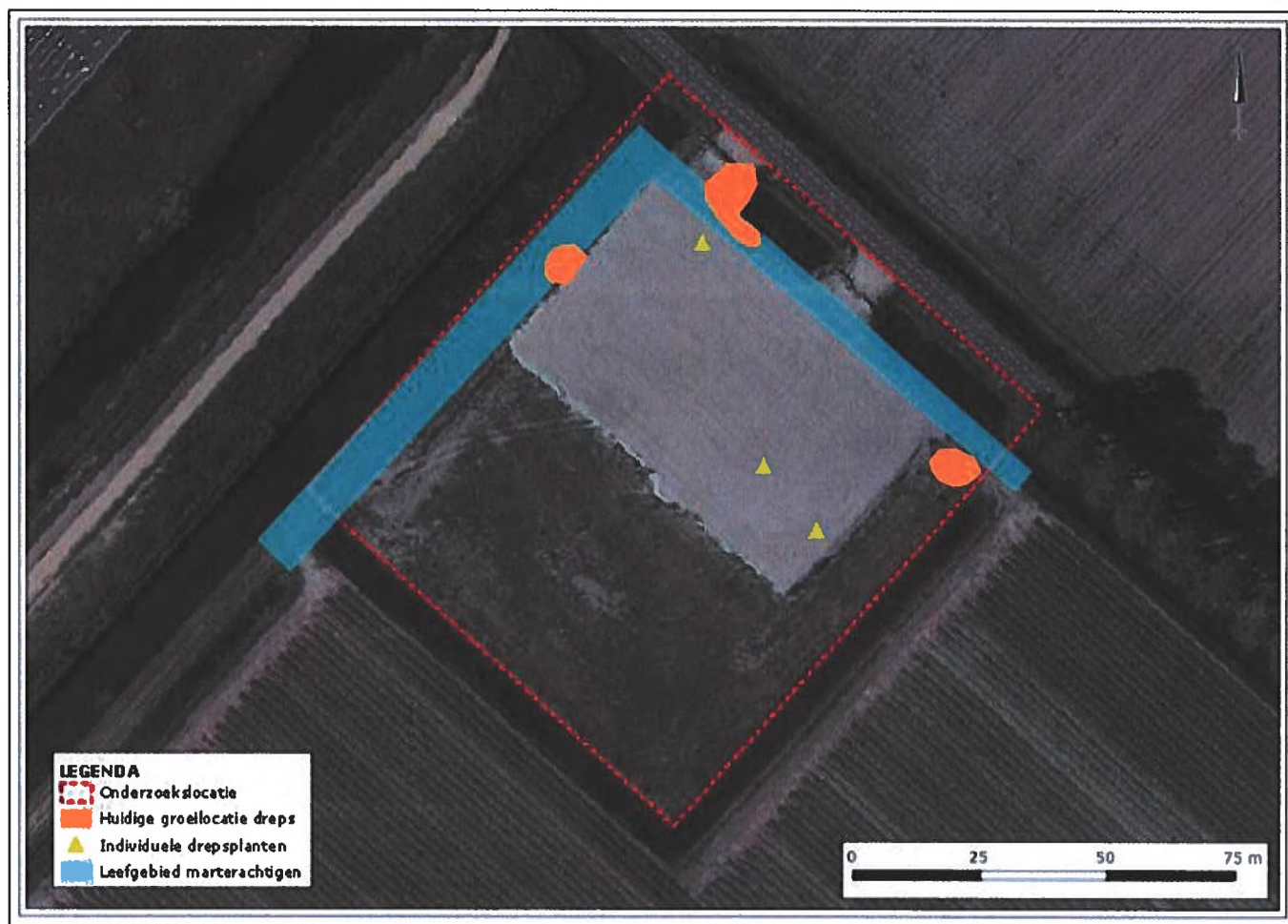
Figuur 3-1. Verspreiding van dreps op de onderzoekslocatie geïnventariseerd op in juni 2022 (rapport 18620.001, versie D1, d.d. 16 september 2022) en het leefgebied van de bunzing, wezel en hermelijn geïnventariseerd in augustus 2022 (rapport G&G-rapport 2022-209, versie V1, d.d. 1 oktober 2022).