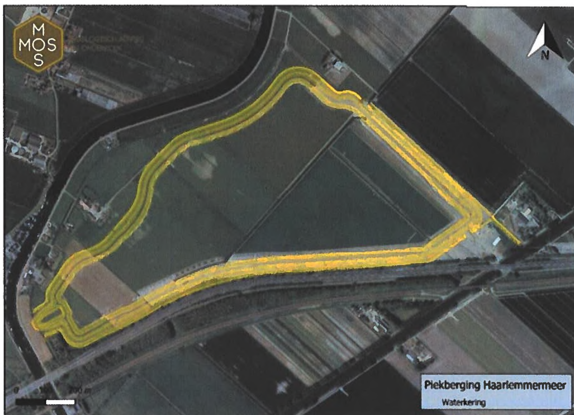
Figuur 1. Locatie plangebied (geel omlijnd).