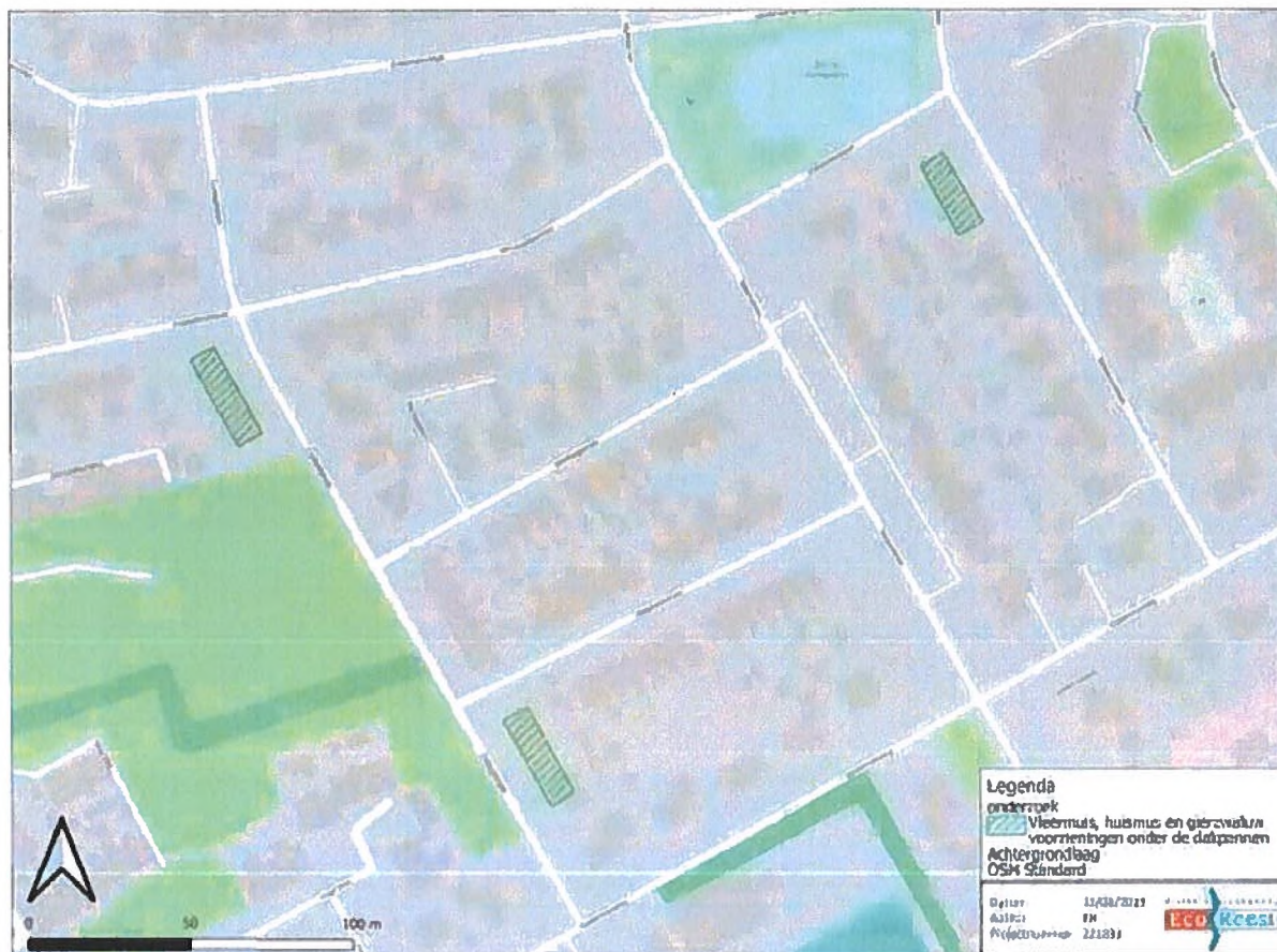
Figuur 1. Locaties van de permanente alternatieve verblijfplaatsen in het plangebied in de vorm van daken geschikt voor de huismus, de gierzwaluw en de ruige dwergvleermuis. De locaties van de permanente alternatieve verblijfplaatsen omvatten alle woningen binnen het plangebied, namelijk de Zuidwalstraat 1 t/m 9 en 18 t/m 26 en Breehornstraat 1 t/m 1c te Den Oever.