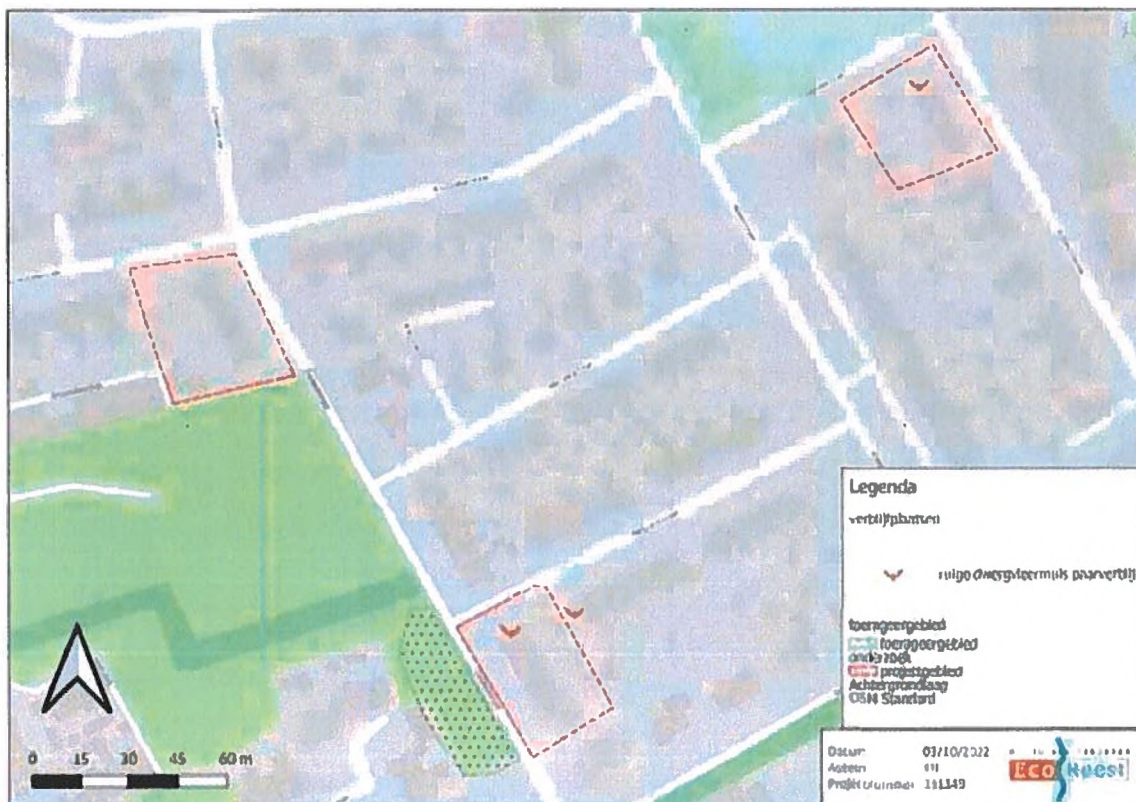
Figuur 3. Vastgestelde locaties van verblijfplaatsen van de ruige dwergvleermuis in (de omgeving van) het plangebied. Binnen het plangebied bevinden zich twee paarverblijfplaatsen van de ruige dwergvleermuis.