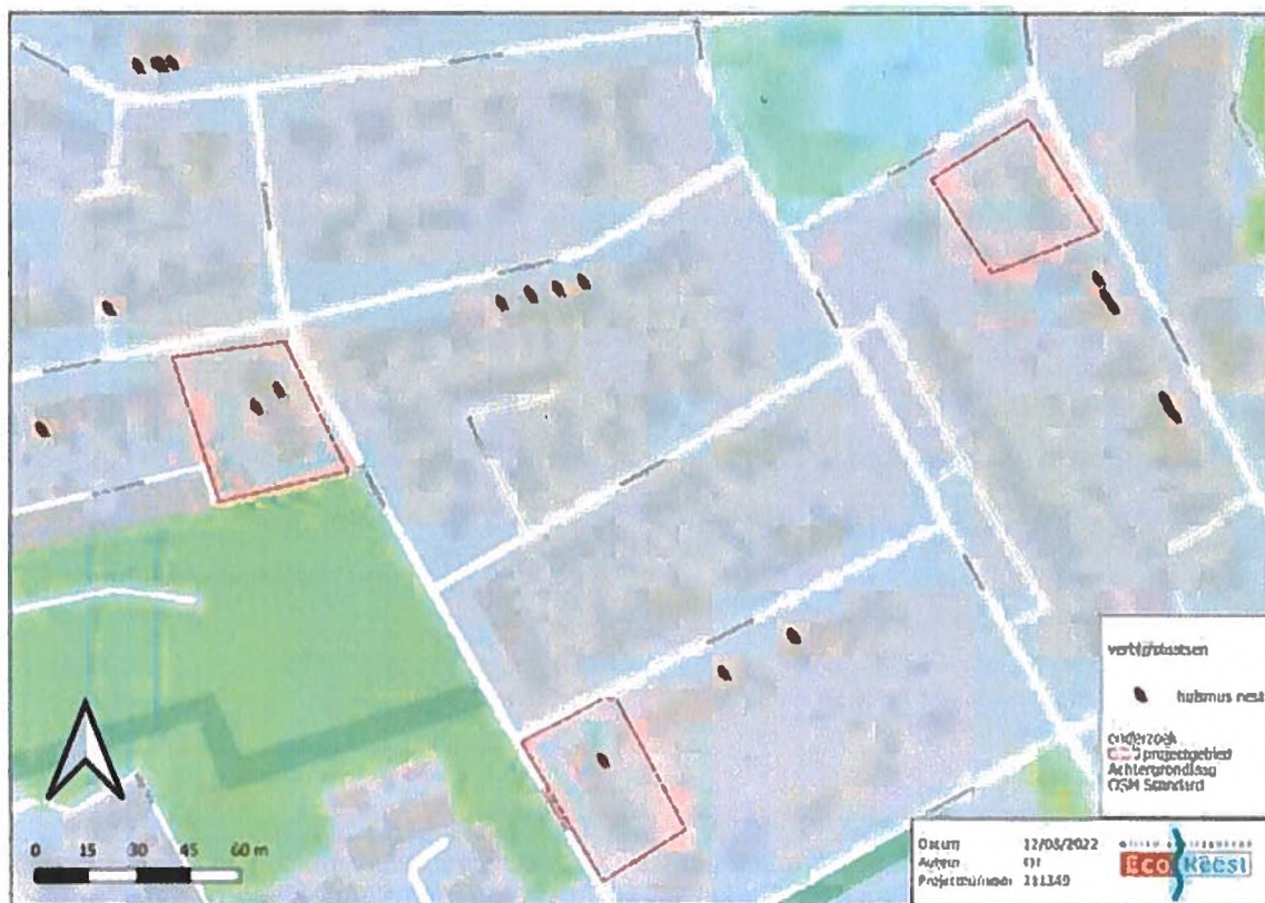
Figuur 1. Vastgestelde locaties van nesten van de huismus in (de omgeving van) het plangebied. Binnen het plangebied bevinden zich drie broedlocaties van de huismus.