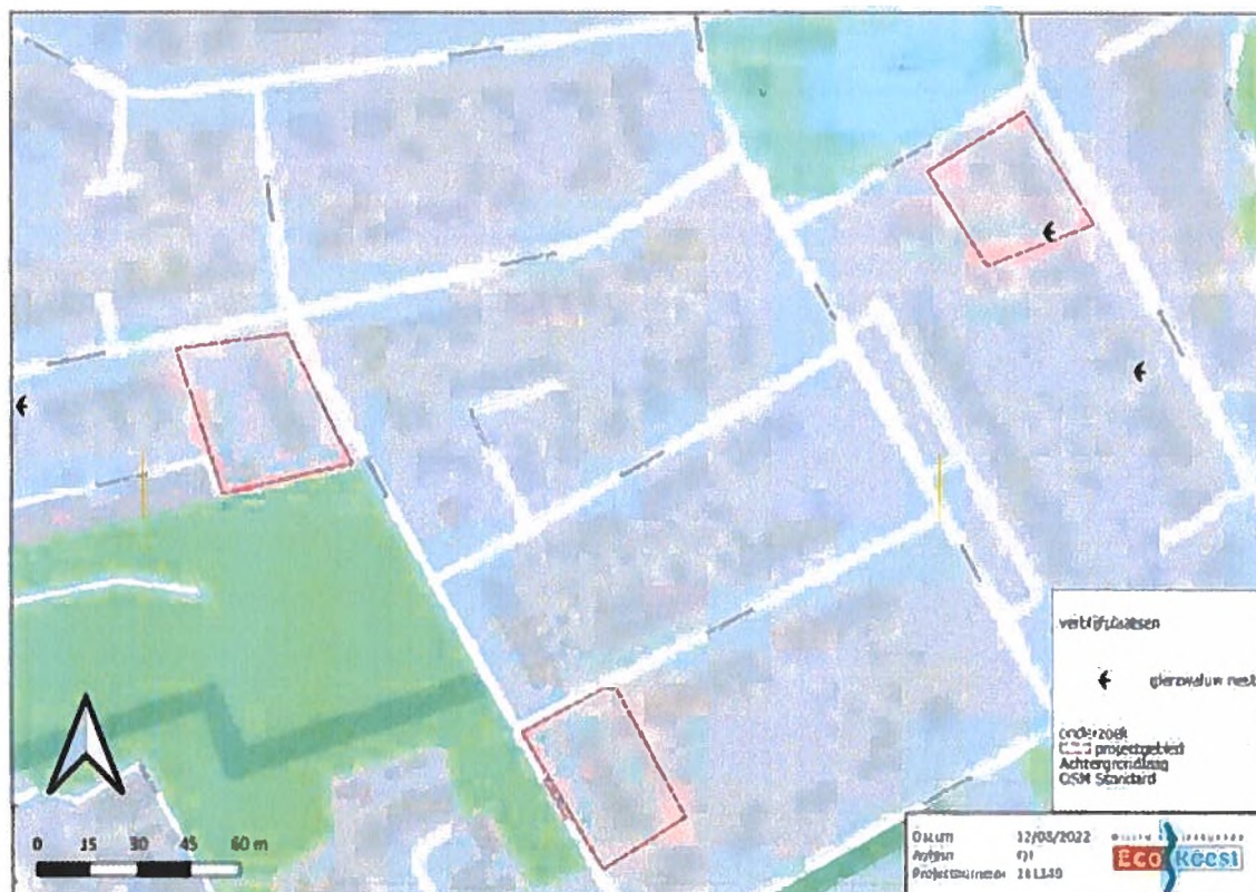
Figuur 2. Vastgestelde locaties van nesten van de gierzwaluw in (de omgeving van) het plangebied. Binnen het plangebied bevindt zich één broedlocatie van de gierzwaluw.