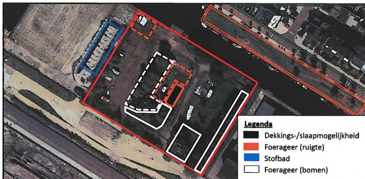
Figuur 4. Indruk van de verdeling van het essentieel leefgebied van huismussen binnen het projectgebied. De gestreepte delen blijven bestaan en de delen met dubbele lijn vallen buiten het projectgebied.