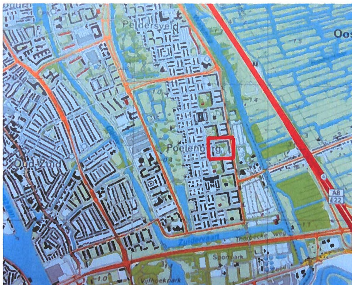
Figuur 1: Weergave van het plangebied aan de Clusiusstraat 92-216 en Poelenburg 205-258 te Zaandam.