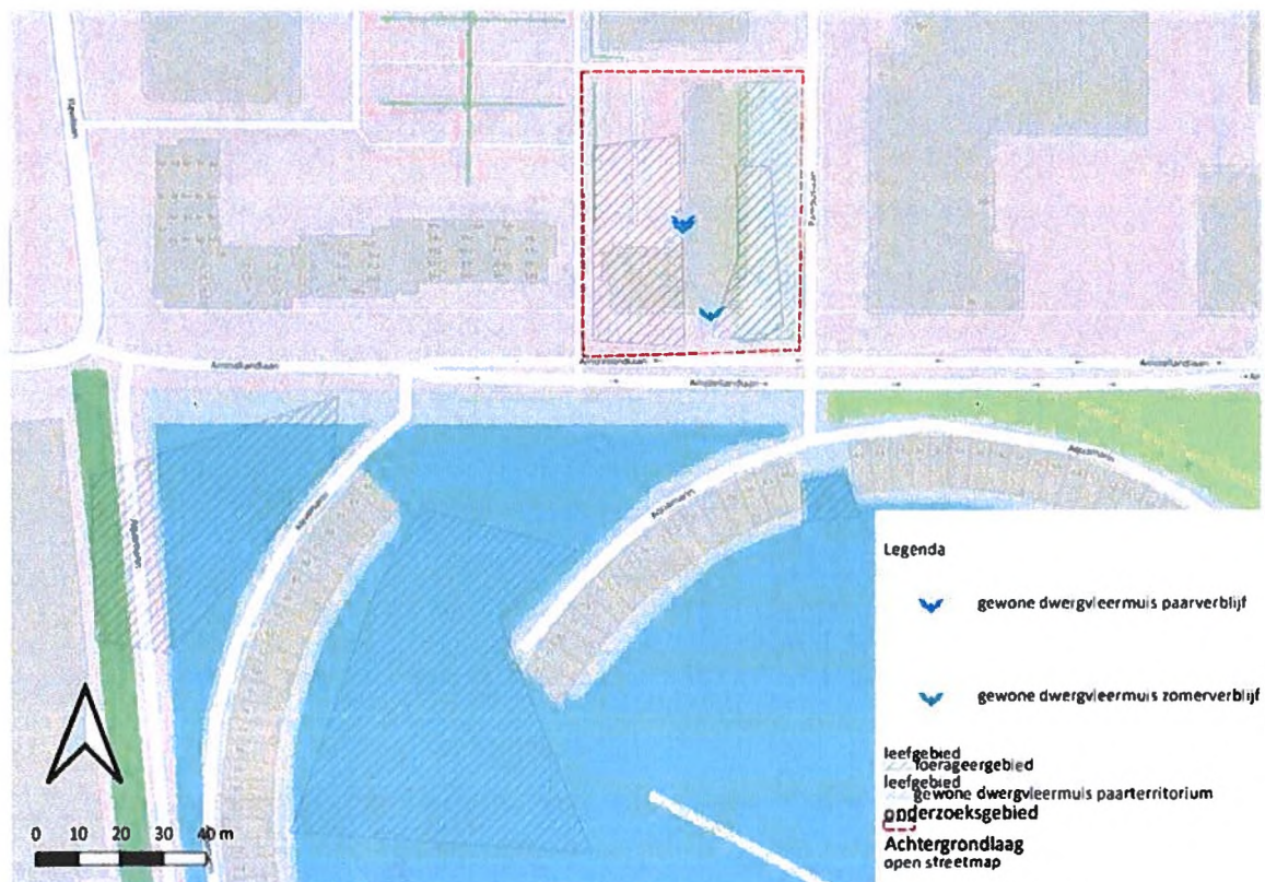
Figuur 1: Locaties oorspronkelijke verblijfplaatsen. Binnen het plangebied bevinden zich drie paarverblijfplaatsen en twee zomerverblijfplaatsen van de gewone dwergvleermuis (totaal = 5). De donkerblauwe vleermuis vertegenwoordigt een paarverblijf. De lichtblauwe vleermuis vertegenwoordigt een zomerverblijf. Het groene gearceerde gebied vertegenwoordigt een voerageergebied (rechts naast het gebouw). Het grijs gearceerde gebied vertegenwoordigt de twee paar territoria van de gewone dwergvleermuis die zijn vastgesteld (links en rechts van het gebouw).