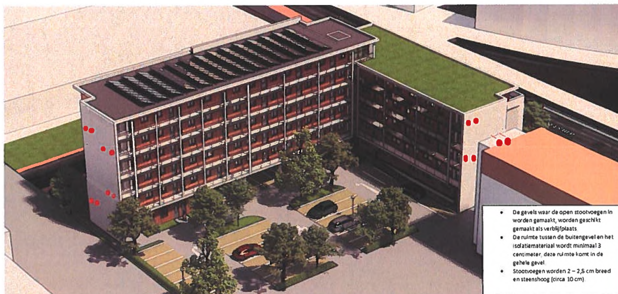
Figuur 2: Locaties permanente alternatieve verblijfplaatsen. De gevels waar de open stootvoegen in worden gemaakt, worden geschikt gemaakt als verblijfplaats. De rode cirkels vertegenwoordigen de locaties van de 14 openstootvoegen.