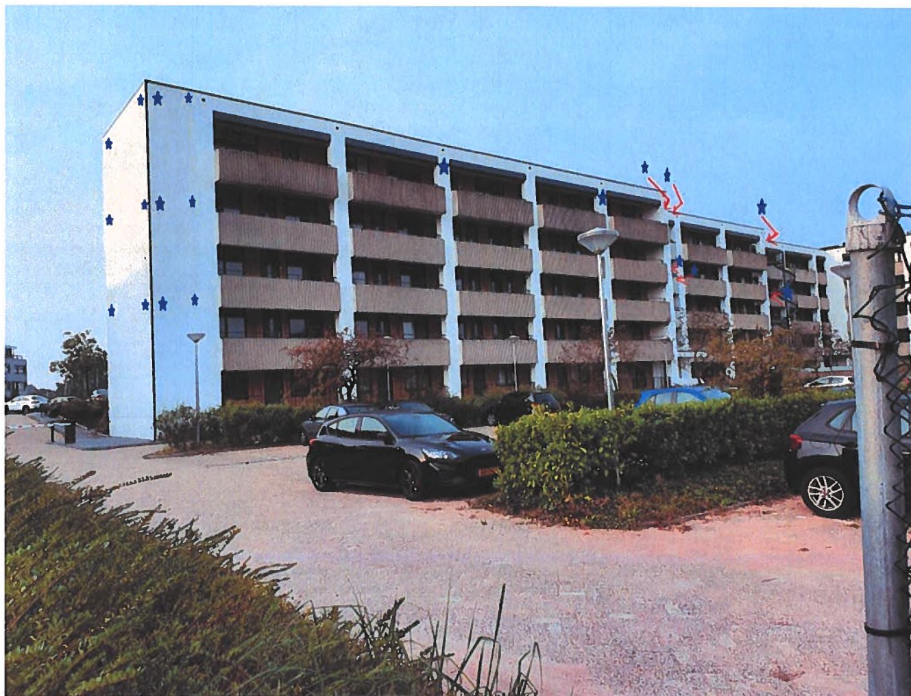
Figuur 1: Locaties tijdelijke alternatieve verblijfplaatsen voor de gewone dwergvleermuis in de vorm van 20 vleermuiskasten (blauwe sterren) gelegen aan de Amstellandlaan 84-86.