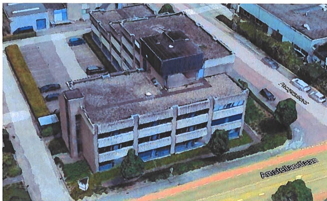
Figuur 2: Weergave van het plangebied (zuidzijde).