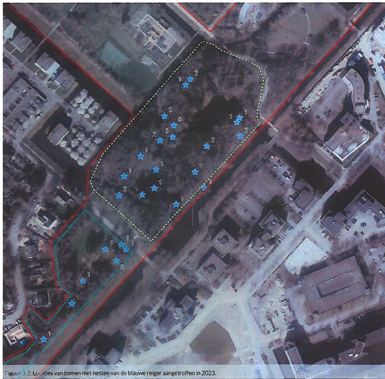
Figuur 3.2: Locaties van bomen met nesten van de blauwe reiger aangetroffen in 2023.