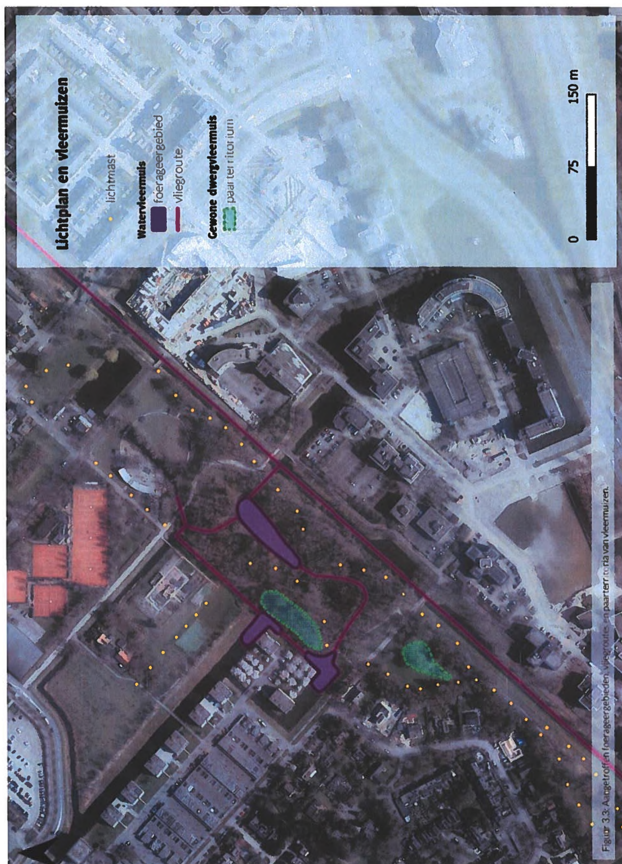
Figuur 1. Aangetoonde foerageergebied/vliegroute/paarterritoria van vleermuizen en geplande verlichting