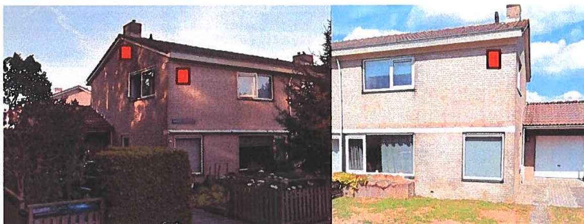
Figuur 2: De drie permanenten kasten worden aangebracht aan de Bernard Zweersstraat 82, één op west en één op zuid, en de Bernard Zweersstraat 72, één op zuid.