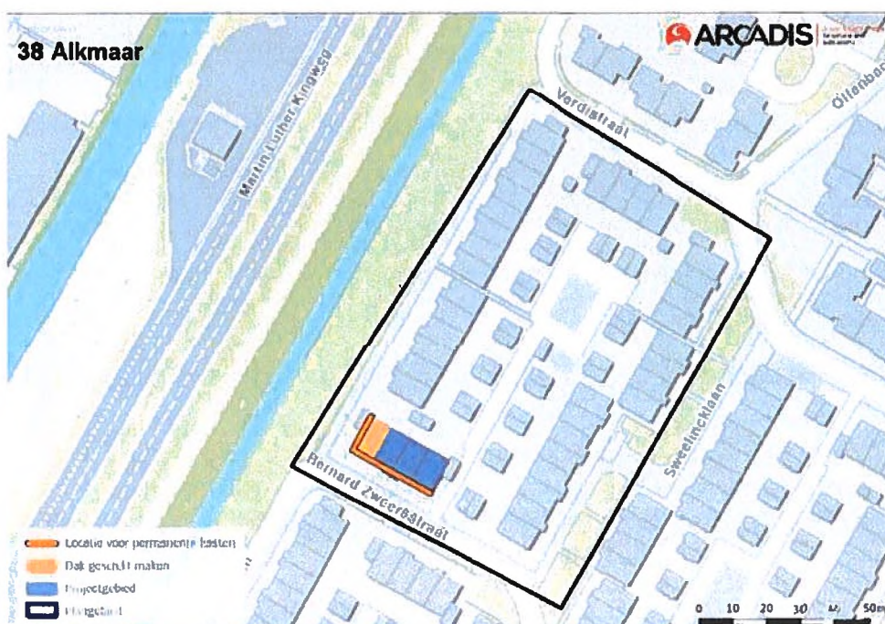
Figuur 1: Locaties permanente alternatieve verblijfplaatsen. Het dak wordt geschikt gemaakt op het hoekhuis Bernard Zweersstraat 82 (oranje rechthoek).