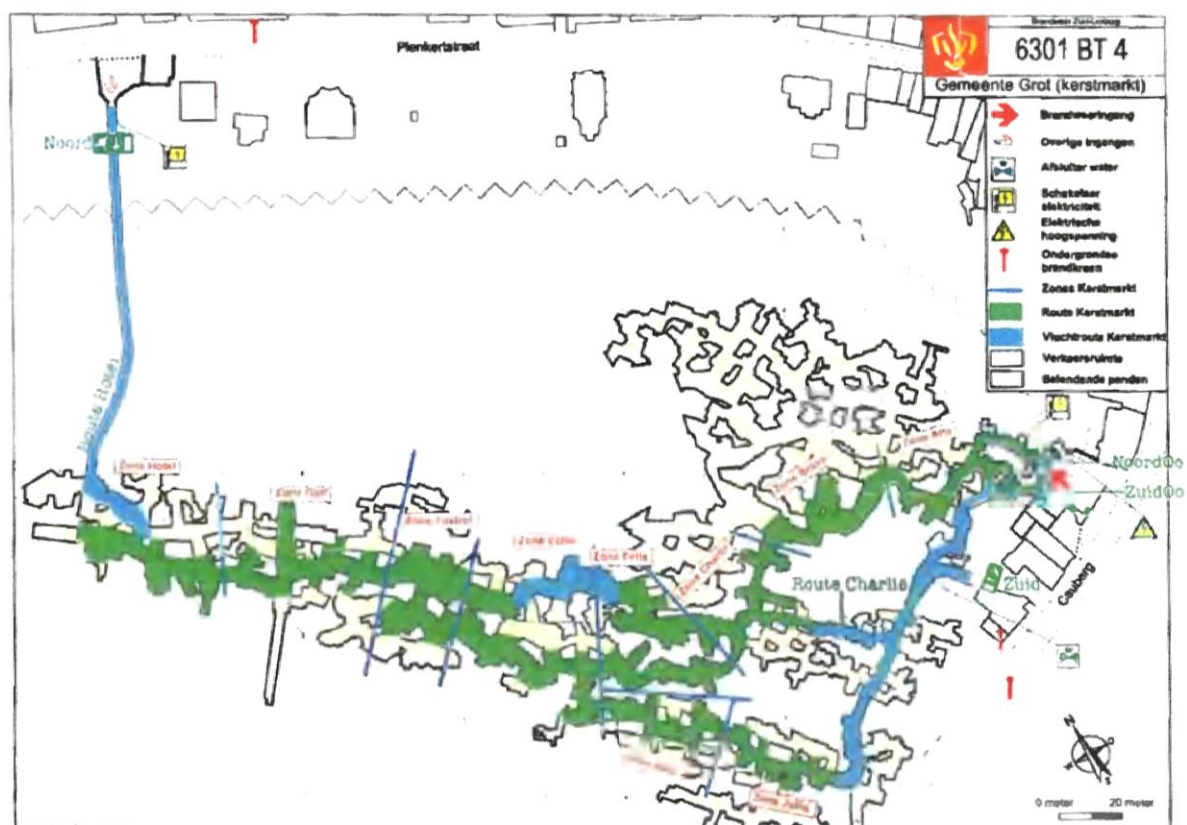
Figuur 1: Kerstmarkt 2017 - Gemeentegrot

Het evenement vindt plaats van 17 november tot en met 23 december 2017. Voor de op- en afbouw van het evenement zijn enkele weken nodig waardoor er werkzaamheden zullen plaatsvinden in de Gemeentegrot van 23 oktober 2017 tot en met 15 januari 2018.