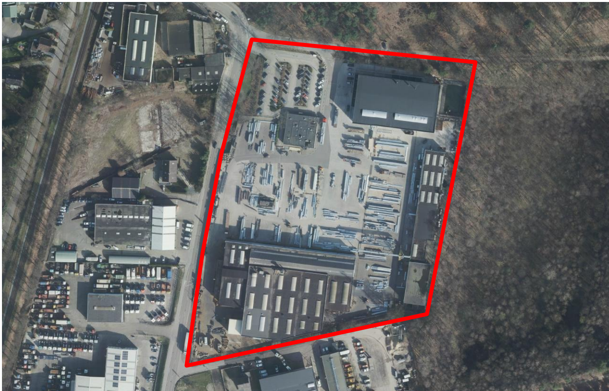
Afbeelding 1 Inrichting The Coatinc Company Holding BV

De inrichting van de aanvrager is gelegen aan de Bovensteweg 56-58 te Mook. De inrichting bestaat uit de deelvestigingen van Coatinc Mook BV en Coatinc PregaNL BV, beide onder de vlag van The Coatinc Company Holding BV als enig aandeelhouder en bestuurder en daarmee aanvrager. De activiteiten binnen de gehele inrichting zien toe op oppervlaktebehandeling en bekleding van metaal, meer concreet het (thermisch) verzinken en veredelen van ijzerproducten.