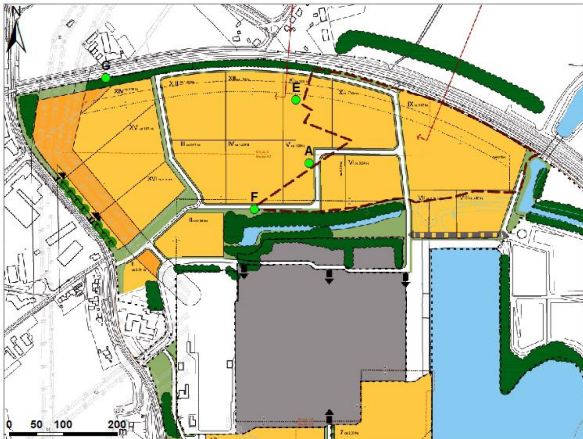
Figuur 3 eindbeeld projectgebied

Het projectgebied maakt deel uit van het plangebied voor bedrijventerrein Zevenellen. Onderstaande figuur geeft het conceptverkavelingsplan (en tevens het eindbeeld van het projectgebied) weer.