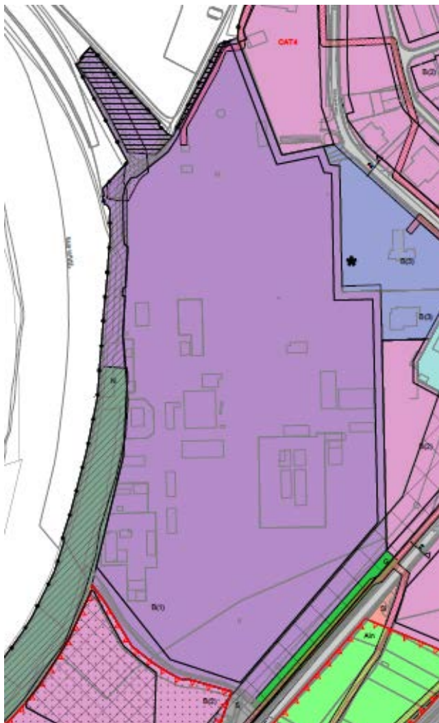
Afbeelding 1: uitsnede plankaart bestemmingsplan 'Zuidelijke Stadsrand'.

De activiteit vindt plaats in een gebied waarvoor het bestemmingsplan Zuidelijke Stadsrand (verder: bestemmingsplan) is vastgesteld op 6 november 2008.