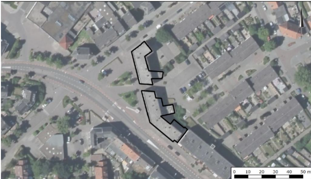
Figuur 1: Het plangebied Joost van Vondelstraat 2 t/m 6b en Kerkraderweg 19 t/m 25b te Heerlen