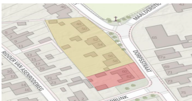
Figuur 1: Het plangebied Dorpsstraat in Asenray

In het plangebied zijn 3 nestplaatsen van de huismus, 3 jaarrond gebruikte verblijfplaatsen van de gewone dwergvleermuis en 3 zomerverblijfplaatsen van de laatvlieger vastgesteld.