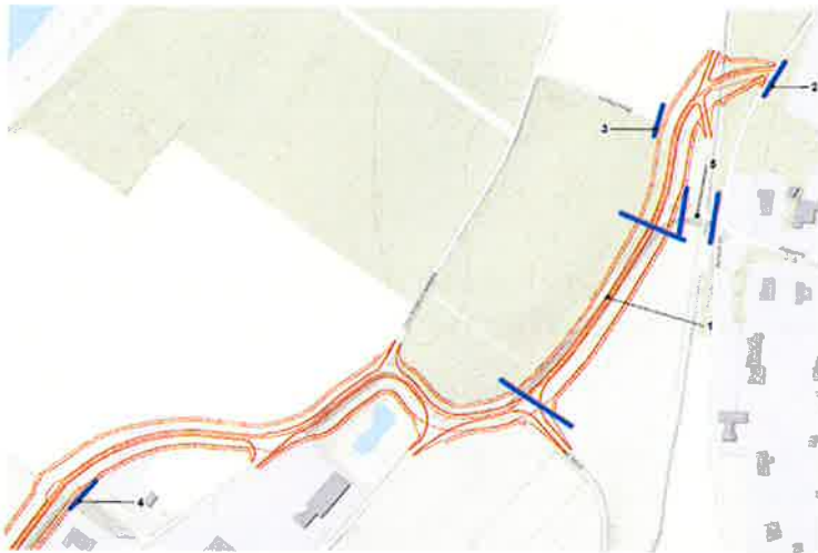
Figuur 1: Overzicht in te stellen verkeersmaatregelen Dijkverbetering Beesel