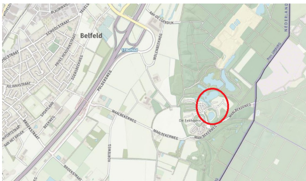
Figuur 1: Het plangebied

Voor de zandhagedis is de huidige leefomgeving niet optimaal en de herinrichting brengt daar geen verbetering in. De zandhagedissen uit het plangebied worden voor aanvang van de werkzaamheden naar een geschikt gebied gebracht in de nabijheid, waar zij aansluiting kunnen vinden bij een andere populatie. Van daaruit kunnen zij hun weg weer terug vinden naar het park Maasduinen. In het gebied tussen de Kaldenkerkerweg en de Beckersweg in Venlo wordt een compensatiegebied ingericht, onder meer voor het verloren gaan van als bos bestemd areaal in park Maasduinen. Dit gebied wordt tevens geschikt gemaakt voor zandhagedissen en vormt een verbinding tussen twee andere leefgebieden. Dit compensatiegebied is nog niet gereed, maar er zijn bestuurlijke en financiële afspraken vastgelegd die de realisatie garanderen.