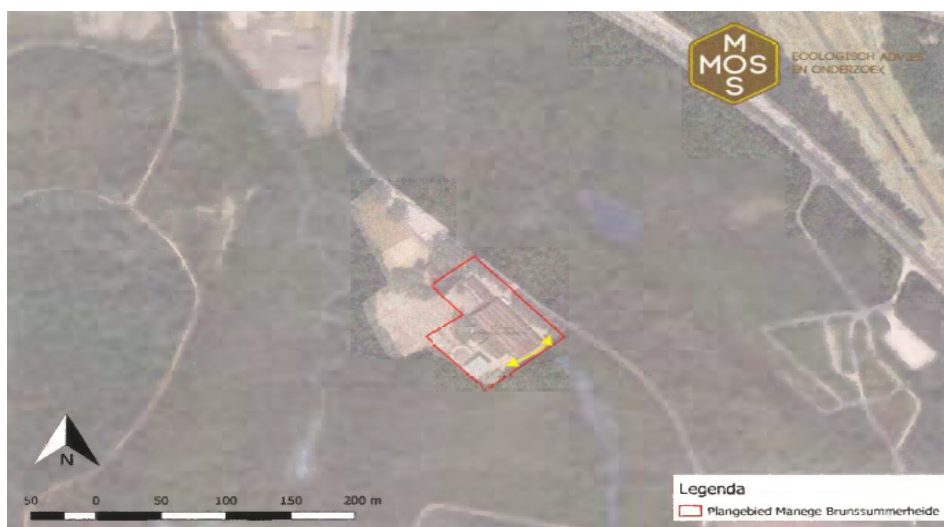
Figuur 1: Het plangebied Manege Brunssummerheide, Ouverbergstraat 4 te Brunssum