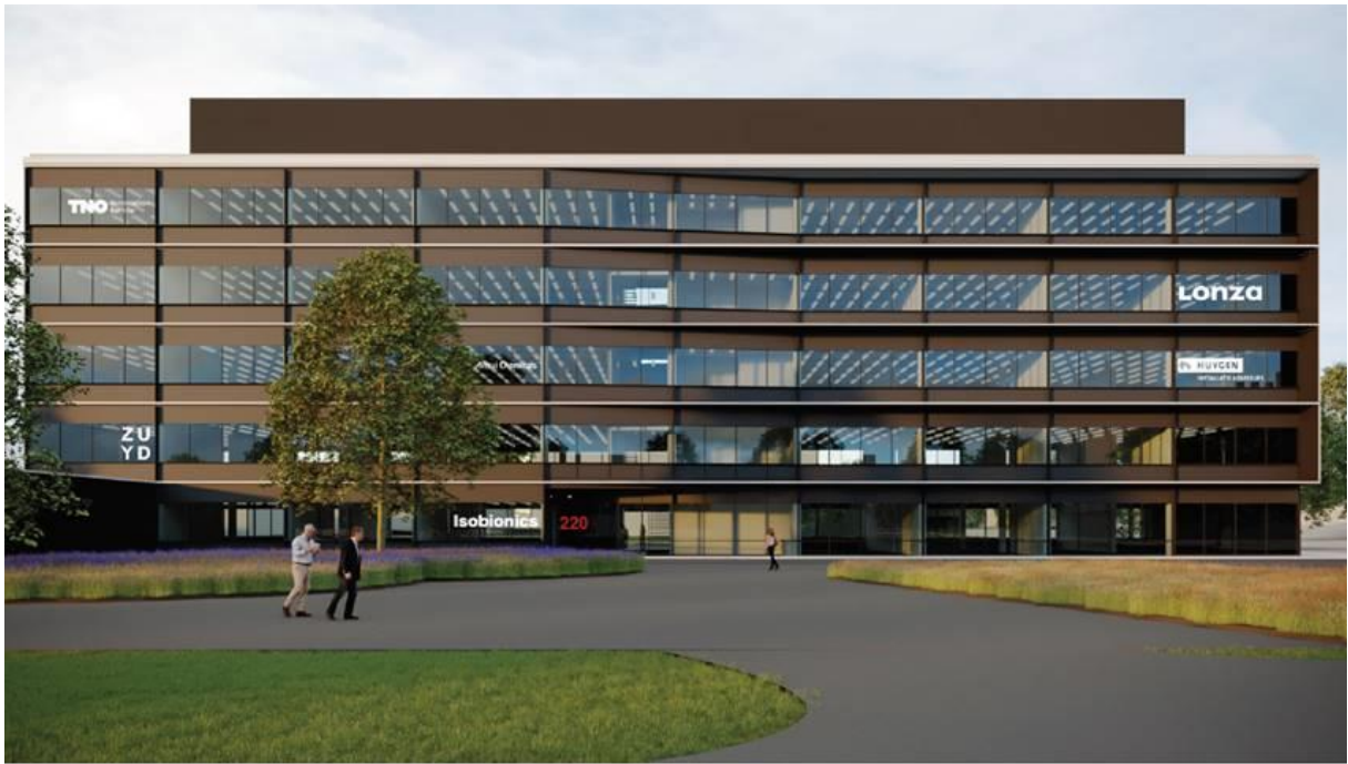
voorbeeld zuidgevel - dag impressie bedrijfsprofilering huidige huurders dd. 04-2019

Wij zien geen aanleiding om over deze aanvraag nog overige adviezen te geven.”